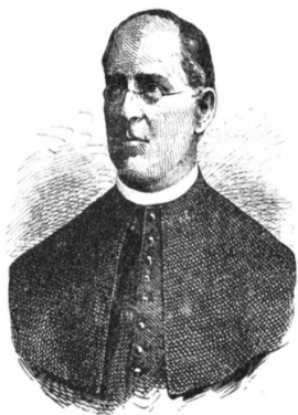
Portret Jurja Žerjavića.

ili srpnju), tj. na dan svetog Alojzija, kada je bila i prva sveta pričest za prvopričesnike. 67 Žerjavić se također skrbio da školska djeca sa svojim učiteljima sudjeluju u svim vjerskim procesijama i svetkovinama. Tako je, primjerice, u Mariji Bistrici svečano obilježena, u suradnji s učiteljima i školskom djecom, 200. obljetnica smrti sv. Alojzija Gonzage. 68 Od ostalog klera, Žerjavić se u Bistrici mogao osloniti i na angažman časnih sestara milosrdnica reda sv. Vinka Paulskog, koje su od 1872. godine boravile u mjestu te se odmah po dolasku uključuju u prosvjetni rad držeći nastavu za djevojčice na postojećoj mještovitoj pučkoj školi. 69 Osim časnih sestara i kapelana, koji su predavali vjeronauk na lokalnoj školi, i sam Žerjavić je bio izuzetno angažiran oko školstva u Mariji Bistrici.