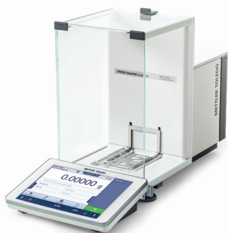
Analička vaga XPR Essential

Analitičke vage XPR Essential daju vrlo precizne i brze rezultate s bitnim značajkama koje su vam potrebne. S mjernom ćelijom visokih performansi i dizajnom viseće posude za vaganje, mali uzorci mogu se vagati s velikom preciznošću, smanjujući otpad i uštedu troškova. Proizvedene u Švicarskoj od visokokvalitetnih materijala, ove vage održavaju poznatu pouzdanost METTLER TOLEDO uređaja.