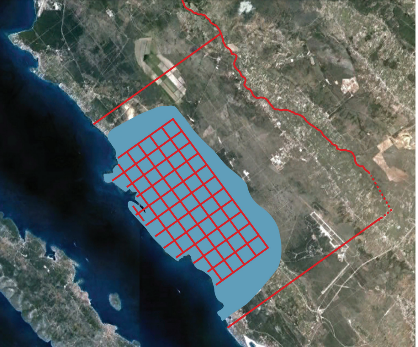
Slika 3. Ager kolonije Jader prema N. Jakšiću (crveno) u odnosu na ager prema M. Suiću (plavo)