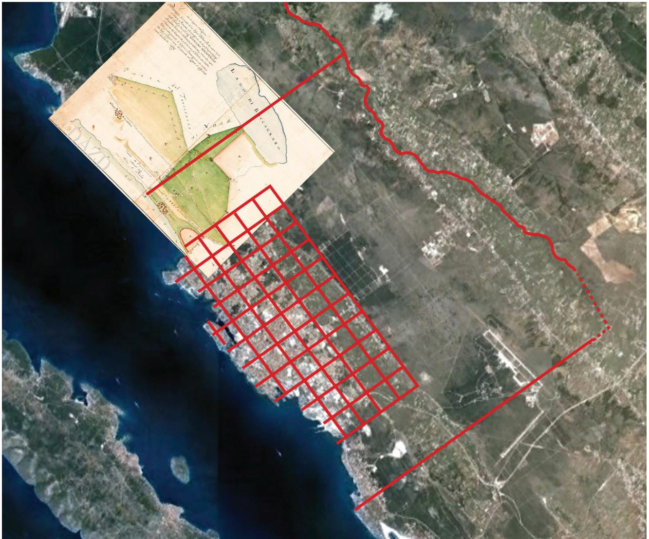
Slika 2. Rekonstrukcija agera kolonije Jader i njezin odnos prema katastarskomu planu Dikla iz 1775. godine (zamisao Nikole Jakšića grafički interpretirao Mladen Košta)