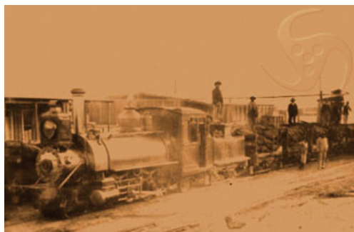
Sl.7. Prijevoz caliche tvorničkom željeznicom

mase koja se lomi pod udarom pijuka, dosežu u dubinu i do 5 m, ponegdje i dublje. Ruda se kopa na površini, pod vječnim užarenim suncem. U preostale donedavne dvije tvornice, to se danas radi strojevima, ali stotinu godina rudača se nakon miniranja barutom razbijala pijukom i lopatama ubacivala u teretna zaprežna kola na dva točka, kasnije u vagonete, koje su do tvorničkih postrojenja vukle mazge. Jedino su one mogle izdržati ove napore.