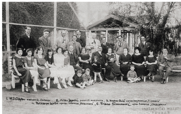
Sl.8. Hrvatski salitrerosi na vrtnoj zabavi 1923. godine

o zlatu na Ognjenoj zemlji i drugim otocima južnih mora stizali najprije iz Buenos Airesa, a kad su vijesti o nalazištima zlata doprle do hrvatskih obala Jadrana, dolazili su izravno iz domovine.