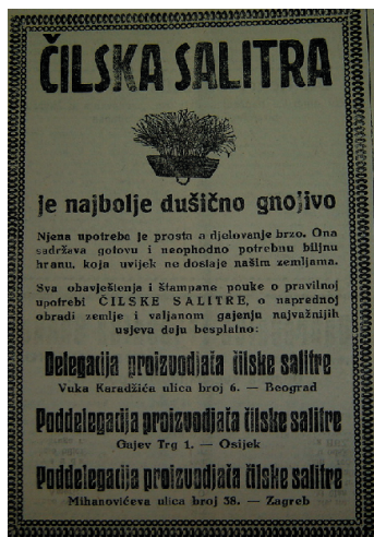
Sl.3. Reklama za uvoz salitre

Neposredan je povod za tvaranju čileanskih salitrera bila saveznička pomorska blokada njihovih izvoznih luka u I. svjetskom ratu kako bi spriječili snabdijevanje neprijateljskih država ovom veoma važnom strateškom sirovinom. Nije se bez osnova govorilo da čilska salitra hrani čitav svijet . Upravo taj em-