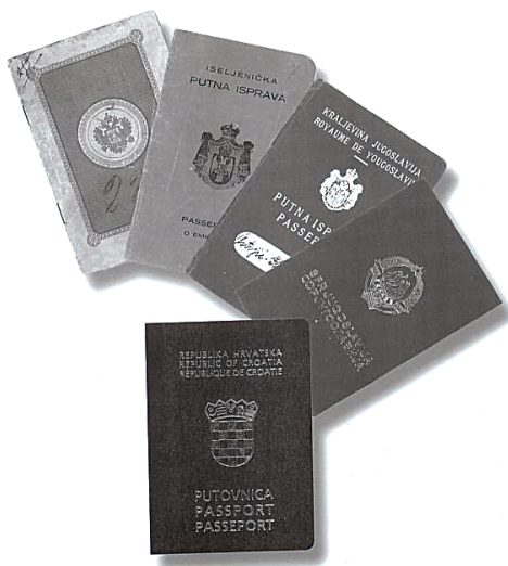
Sl.10. Putovnice

po rođenju, Jorge Matulić Zorinov, u svojoj knjizi "Chile" (Zagreb, 1923.): «Uzme se transandski vlak na stanici "Retiro" u nedjelju ili srijedu u 8,30, prođe se cijelom pampom, te se stigne sutradan u 5,30 u Mendoza, lijepi i ubavi grad, središte argentinskog vinogradarstva. Uru kašnje vlak prosljedi put Kordiljera; u 7,30 proputuje se kroz glasovite termalne kupke "Cachenta" i u 13,15 sati se stigne u Puente del Inca (2 719 m) glasovite radi svojih termalnih voda i sjajnog hotela. Odavle se može promatrati veličanstvenu Aconcaguau od 7 000 m visine, najviše brdo na kontinentu. U 14.30 transandski vlak stigne u Las Cuevas, zadnju argentinsku stanicu; prođe se zatim kroz 3 200 m dugi tunel i tako se stigne do stanice Caracoles, koja je već na Čilenskom tlu. U 18,37 vlak stiže u Los Andes (821 m), gje se zaustavi da putnici ručaju. Zatim se uputi prema Llay-Llay, da prosljedi do Santiaga ili Valparaisa kamo stigne u 23,25.»