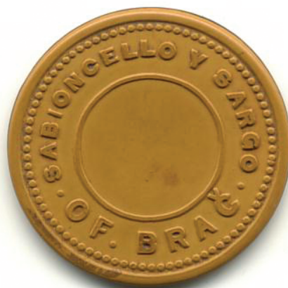
Sl.6. Ficha (žeton) salitrere Brac

dnevne temperature penjale su se i preko 50 °C, noćne se spuštale do nekoliko gradi ispod ništice, desetljećima bez kiše. Umiralo se od tuberkuloze i neishranjenosti. Trgovine, prenoćišta, radničke nastambe jedva da su služili svrsi. Uglavnom su to bile daščare pokrivena limom zvučnih naziva: Hotel Londres , trgovina América , gostionica Casablanca , salitrera Gloria . U trgovinama se plaćalo žetonima ( fichas 3 ) na kojima je stajao naziv salitrere koja ih je emitirala . Danas ih možemo kupiti za dolar na buvljacima Santiaga i mjesta na sjeveru, ali uz obvezatnu provjeru autentičnosti.