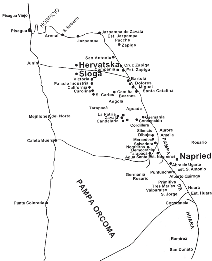
Sl.1.a. Tvornice salitre na sjeveru Čilea

Opća enciklopedija iz 1980. godine i Atlas svijeta Hrvatskog Leksikografskog zavoda obavješćuju nas da je salitra staro ime za neke tehn. važne soli nitratne kiseline. U staro se doba tim imenom ( sal nitrum ) nazivao kalijev nitrat, koji je u Egiptu i Indiji nastajao u znatnim količinama truljenjem organskih tvari u kalijem bogatom tlu, a poslije se u Europi u posebnim plantažama proizvodio na analogan način iz organskih otpadaka i potaše kao sirovina za proizvodnju baruta. I dalje: Salitra iz Čilea, već jedno stoljeće poznata kod nas pod trgovačkim nazivom čilska salitra je mineral, natrij-nitrat, \text{NaNO}_3 i pojavljuje se u kristalastim agregatima ili u zrnu, staklenasta sjaja. Nalazi se u velikim količinama u sušnim krajevima na sjeveru Čilea u zoni dugačkoj 1000 km i širokoj 60 km. Sirovina caliche prerađuje se na ležištu u mnogobrojnim tvornicama, koje raspolažu svojim željezničkim prugama i flotom pomorskih brodova. Osim Čilea, poznata su nalazišta salitre u Peruu, Kolumbiji, Sjevernoj Americi, Alžiru i Maroku. Upotrebljava se kao obično gnojivo, te u kemijskoj industriji. Vađena je i u Makedoniji, za proizvodnju baruta. Danas se pretežno proizvodi iz sintetske nitratne kiseline i sode ili natrij-hidroksida. Uz dopunu, da je upravo umjetna salitra, ili kako običavamo reći, umjetno biljno gnojivo, zamjenilo salitru, prirodno biljno gnojivo. Prirodna salitra je gotovo nestala sa svjetskog tržišta.