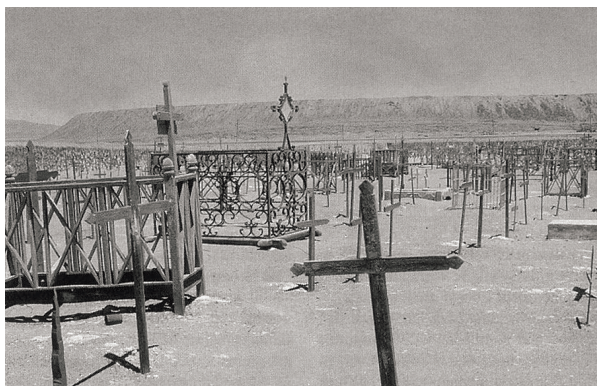
Sl.5. Zaboravljeno groblje u čileanskoj pampi

Za većinu Čileanaca povijest njihove zemlje počinje sa španjolskim osvajanjima (1536.), uči se u školama o osvajačima, Pedru de Valdivia, Diegu de Almagro i dr. kao o nacionalnim herojima, ali mnogo toga je na toj zemlji počelo puno stoljeća ranije. Tako ni salitra ne počinje sa Španjolcima, već s Inkama. Veliki poznavalac povijesti čilske salitre Luis Maldonado Rios, Čileanac, ustvrdio je da su Inke, kao i plemena Aymará, Chango i neka druga, proizvodili salitru i njome se služili. Ipak, zlatno doba salitre počima s prvom industrijskom proizvodnjom oko 1810. godine, najprije kao sirovina za proizvodnju baruta u Perúu, a potom kao biljno gnojivo. Danas bismo rekli u mirnodopske svrhe . Prvi brodovi sa salitrom kao biljnim gnojivom isplovili su 1830.