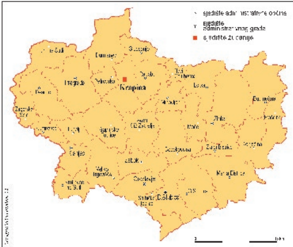
Slika 1. Karta Krapinsko-zagorske županije

poduzećima i mogućnosti bavljenja turizmom. Ova županija je jedno od rijetkih područja u Hrvatskoj koje na bogatstvu antropogenih i prirodnih turističkih resursa može razvijati mnoge vrste i oblike turizma, a posebno zdravstveni turizam.