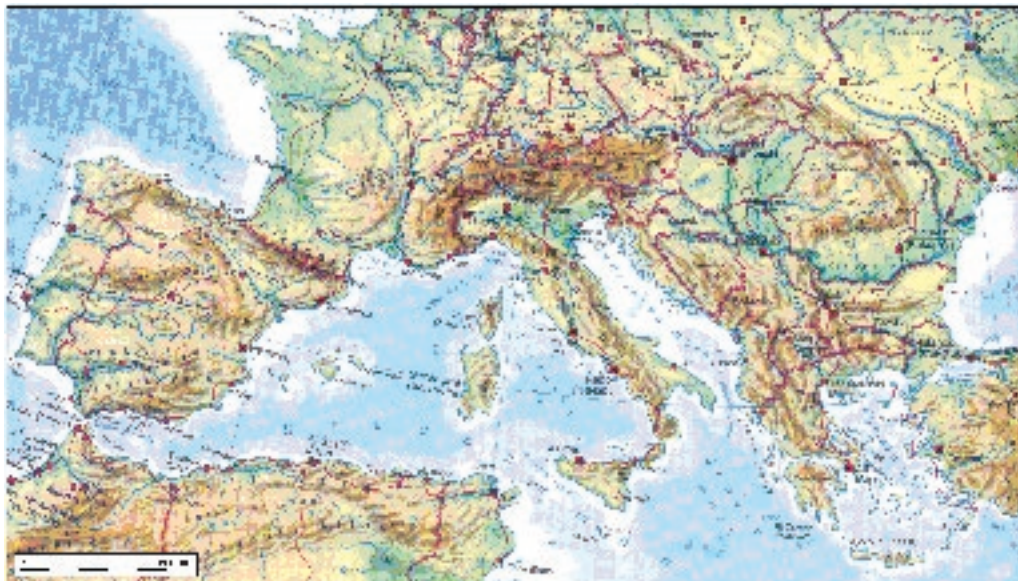
Sl. 2. Sredozemlje

Pogledamo li Opću Enciklopediju nećemo naći natuknicu Sredozemlje, a pod pojmom Mediteran nalazi se uputnica na Sredozemno more. Opći i Pomorski leksikoni donose pojednostavljenu odrednicu da je Sredozemlje zajednički naziv za zemlje uz Sredozemno more, u kojoj će geografi brzo zapaziti manjkavosti.