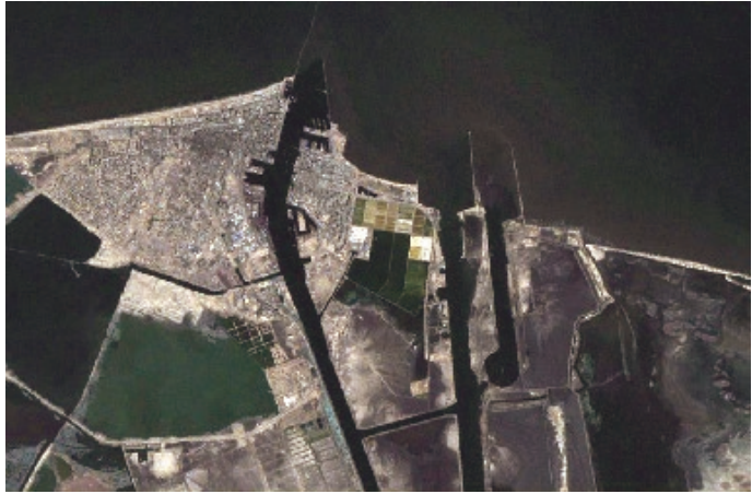
Sl. 9. Detalj Sueskog kanala na satelitskoj snimci

Prokopavanjem Sueza (1869.) počinje nova etapa u značenju Sredozemnog mora koje postaje glavni posrednikom u prometu između luka na Atlantskom oceanu s lukama na Indijskom oceanu. Slijedećih stotinjak godina Sredozemljem prolazi jedna od najprometnijih pomorskih veza svijeta. Sueski kanal zatvoren je tijekom Arapsko-Izraelskog rata iz 1967. Ponovno je otvoren 1975., no u