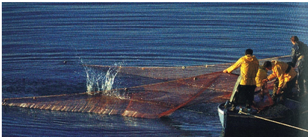
Sl. 12. Ulov ribe

međuvremenu izgrađeni golemi supertankeri više ne mogu prolaziti njime.