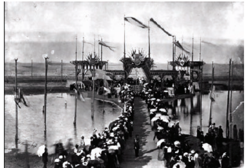
Sl. 10. Otvaranje Sueskog kanala 29.11.1869.