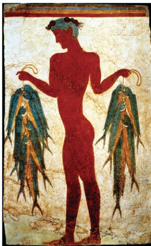
Sl. 7. Detalj freske

ne. Razvedene obale i mnogo otoka olakšavali su plovidbu i sigurno sidrenje. Najstarija civilizacija na obali Sredozemnog mora bila je Egipatska i potom nešto mlađa Egejsko-kretska. Na Kreti nesumnjivo nastaje prva talasokratska država koja prevladava iz