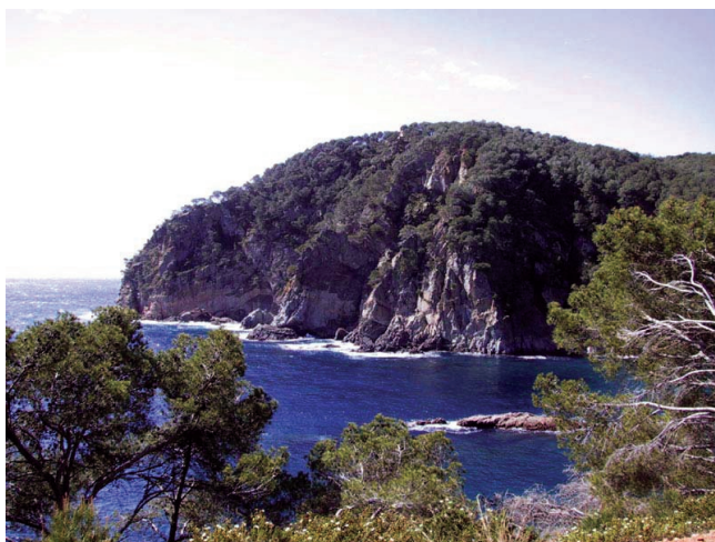
Sl. 8. Sredozemni krajolik

U 3. st. pr. Krista javljaju se Rimljani, koji su se svladavanjem Kartage (246. do 146. pr. Krista) proširili duž sredozemnih obala. Mnogi se teoretičari slažu da je upravo s rimskim razdobljem otpočela zbiljska europska povijest. U 2. st. nove ere Rimsko Carstvo je vladalo svim zemljama na obalama Sredozemnog mora, osim što nisu okružili Crno more. Rimljani su Sredozemno more nazivali Mare Nostrum (Naše more) i Mare Internum (Unutrašnje more). Često preuzimajući najbolje od onih koje su osvojili, Rimljani su preuzeli velik dio grčkog naslijeđa ali ostavili i vlastito golemo kulturno, političko-pravno, filozofsko, znanstveno i religijsko naslijeđe. Po mnogima je Rimsko razdoblje i njegovo naslijeđe trajno povezalno Sredozemlje u jednu cjelinu. Poznata je uloga rimskih cesta, no nesumnjivo je da Rimskog carstva ne bi bilo bez pomorstva. Uloga rimske mornarice u konstrukciji Carstva nagovješćuje sraslost tehničkog umijeća, brodogradnje i moreplovstva, i političkog poretka Carstva. Da Rimljani nisu naučili ploviti teško bi se Carstvo u tako proširenim granicama održavalo tako dugo. Rimaska je država dar Sredozemlja, a mogli bi dometnuti