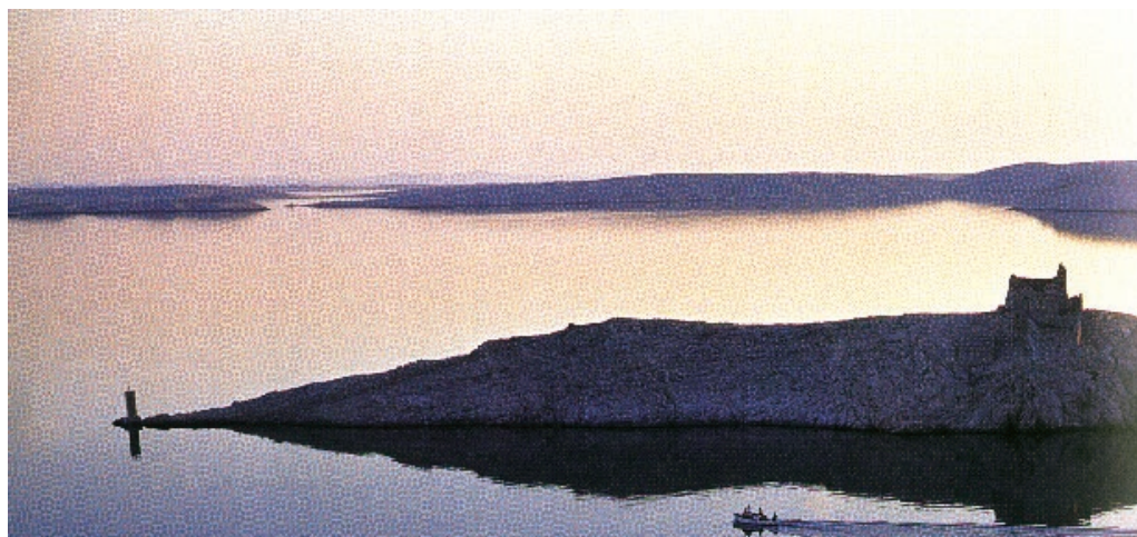
Sl. 1. Jadranski otoci-Pag

Sredozemno more sastavni je dio Atlantskoga oceana, s kojim je ostvorena prirodna veza preko Gibraltarskih vrata, odnosno tamošnjeg podmorskog praga – Gibraltarskog praga. Sredozemno more pruža se od Gibraltarskih vrata na zapadu do najistočnijeg mjesta Crnog mora u dužini od 3860 km, a najveća mu je podnevnička širina (sjever – jug) između Hrvatske i Libije iznosi 1750 km. Prostire se na oko 3 milijuna četvornih kilometara i zaprema gotovo 4,4 milijuna prostornih kilometara. Najveća mu je dubina 5121 m. Razmjerno je razvedeno more s više većih i mnoštvo manjih poluotoka i otoka. Duljina svih obala u Sredozemnom moru iznosi približno 38,5 tisuća kilometara, od čega na kopnene obale otpada 25,2 tisuće kilometara, a na otočne 13,3 tisuće kilometara. Mesinskim i Sicilskim prolazom, odnosno pragom Aventure između otoka Sicilije i Tunisa povlači se granica između zapadnog i istočnog dijela Sredozemnog mora. (konvencionalno je to crta koja spaja rt Paci na obali Kalabrije i rt Peloro na Siciliji, zatim prati sjevernu obalu Sicilije do rta Lilibeo na zapadnoj obali Sicilije od kojeg se spaja na rt At-Tib ili Bon u Tunisu). Zapadni dio Sredozemnog mora je manji (oko 821,6 tisuća četvornih kilometara), manje razvedenih obala, plići i mirnijeg reljefa dna. Istočni, veći i dublji dio Sredozemnog mora prostire se na 2144,3 tisuće četvornih kilometara, obale (posebno Euroazijske) su razvedene, a reljef dna živ.