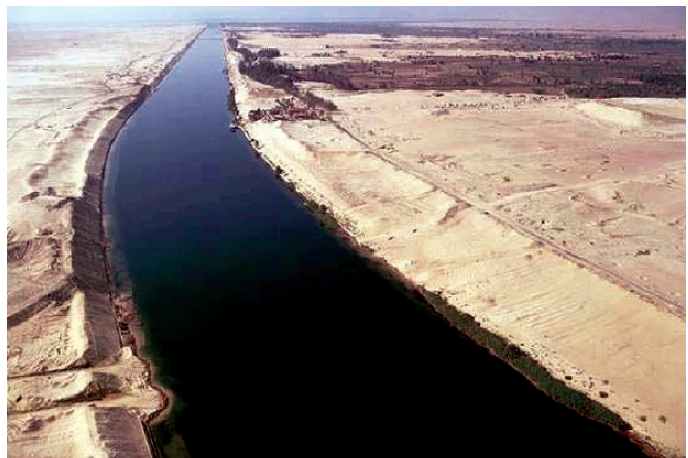
Sl. 11. Sueski kanal danas