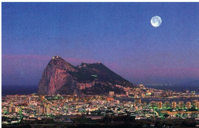
Sl. 13. Sredozemlje-turističko područje svjetskog značenja

Sredozemno more nema značenje svjetski važnog ribolovnog područja, no važan je izvor hrane stanovnicima Sredozemlja. Daleko najvažnija je uloga Sredozemlja kao svjetski najznačajnijeg prijamnog turističkog područja. Sredozemlje privlači prirodnom ljepotom i bogatim kulturno-povijesnim nasljeđem milijune turista iz Europe i svijeta svake godine.