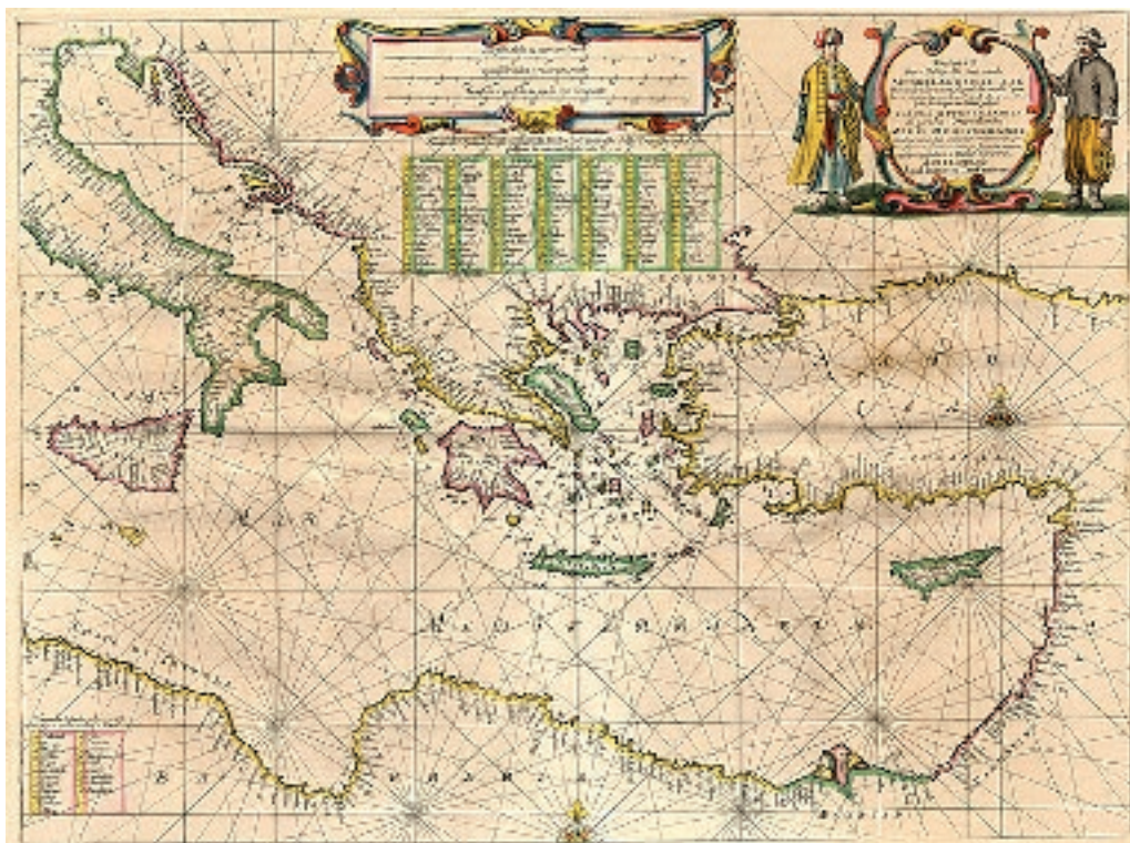
Sl. 5. Portulan istočnog Sredozemlja iz 17. stoljeća