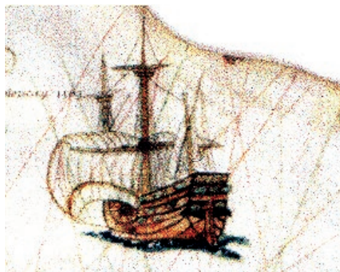
Sl. 6. Detalj s portulana iz 16. stoljeća

Blago podneblje od davnine je poticalo naseljavanje obala Sredozemnog mora. Razmjerno mirno more i uglavnom postojani, no ne i prejaki vjetrovi omogućili su razmjerno sigurnu plovidbu tijekom većeg dijela godi-