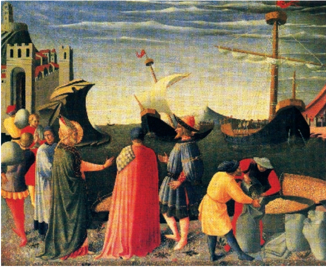
Sl. 5. Izvoz žita u luci u Bariju, 16. st. (detalj slike Fra Angelica, Pinacoteca, Vatikan)

Ti ritmovi i ciklusi otkrivaju one najdublje slojeve u odnosima čovjeka i okoline koja ga okružuje. Jedino oni mogu izlučiti trajne vrijednosti u odnosu čovjeka i prostora, a to su vrijednosti civilizacije.