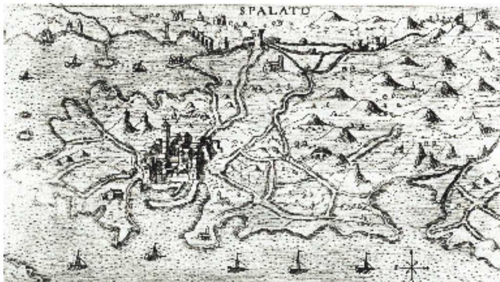
Sl. 1. Cestovne veze sa zaleđem Splita u 16. st., (Venecija)

Braudel je strasno volio Sredozemlje. Želio je objasniti povezanost prostora i vremena u Sredozemlju. «... Sredozemlje nije jedno more, to je skup mora, mora nakrcanih otocima, ispresijecanih poluotocima, okruženih razvedenom obalom. Njegov je život pomiješan sa zemljom, njegova je poezija uglavnom rustična, njegovi su mornari istodobno i seljaci; ono je more maslina i vinograda kao i uskih čamaca na vesla ili trbušastih brodova trgo-