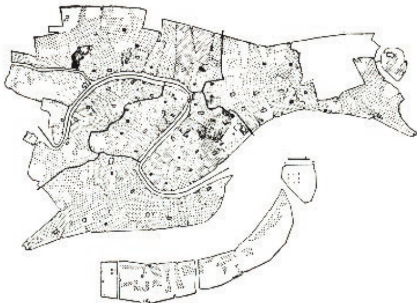
Sl. 3. Venecija: Stanovništvo u 16. st. 1 točka = 10 stanovnika