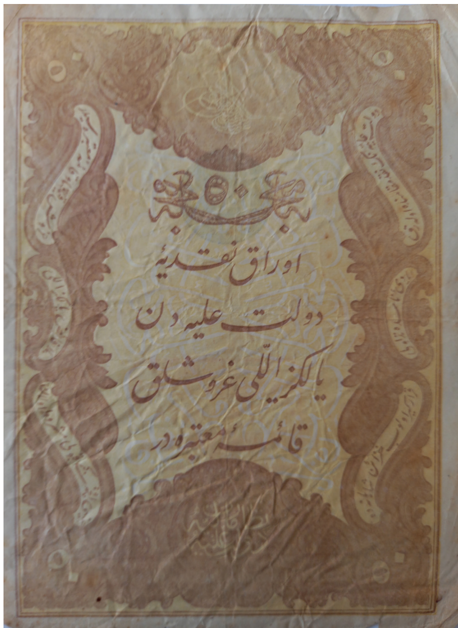
Slika 4: Lice kaime od 50 kuruša iz 1877. (AH 1295.) promijenjene boje koja nije bila u optjecaju u Bosni i Hercegovini