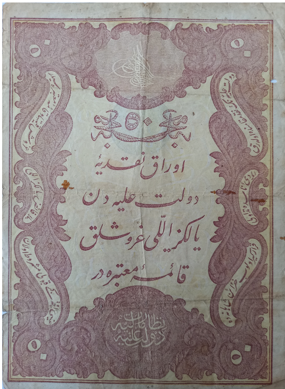
Slika 2: Lice kaime od 50 kuruša iz 1877. (AH 1294.) koja je bila u optjecaju u Bosni i Hercegovini