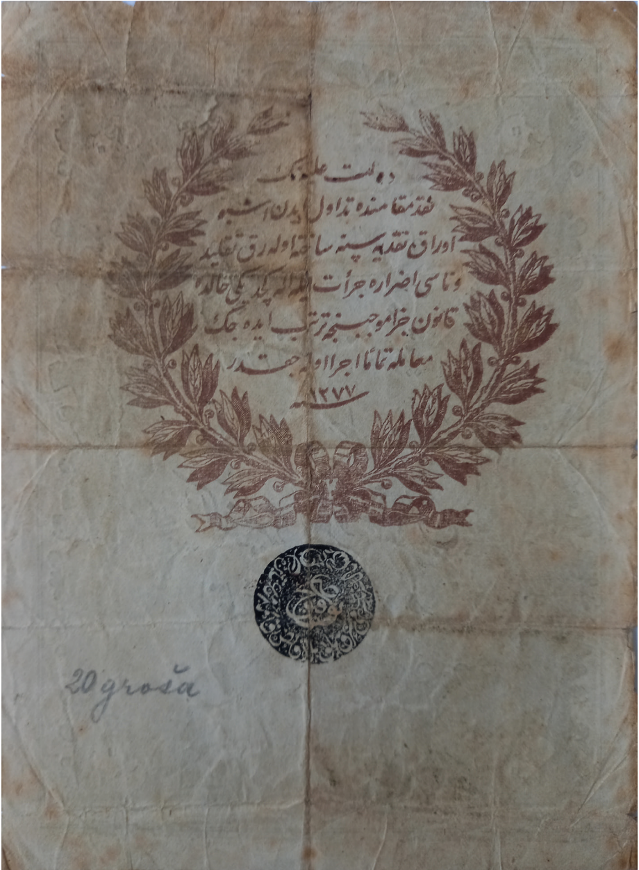
Slika 1: Naličje kaime od 20 kuruša iz 1861. (AH 1277.) likvidirane 1862. godine