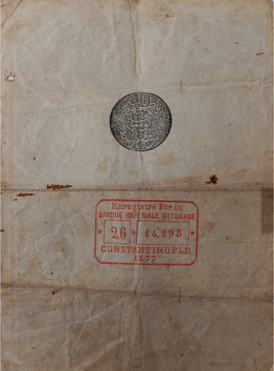
Slika 3: Naličje kaime od 50 kuruša iz 1877. (AH 1294.) koja je bila u optjecaju u Bosni i Hercegovini