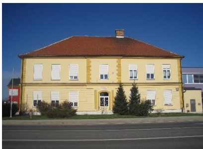
Slika 6: Nova školska zgrada

ON Br. 51415 od 8. prosinca 1933., dok je 1957/58. postala puna osmogodišnja škola sve do uvođenja devetogodišnjeg obveznog školovanja u današnje vrijeme [6].