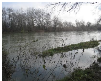
Slika 1: in 2: Korito rijeke Drave nekad i sad