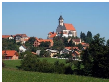
Slika 5: Pogled na Ptujsku Goru

Slika 3: in 4: Dvorac Ravno polje nekad i danas Ni Turci nisu štedjeli naše teritorije. Već 1478. godine opljačkali su i spalili područje današnjeg Dravskog polja. Godine 1493. ponovno su napali Ptuj i Gornje Dravsko polje. U to su vrijeme stanovnici današnjeg područja Starša osjetili najgora zlodjela Turaka. Ponovno su pljačkali i palili 1532. godine duž Štajerske prema Vurberku. Kako ga nisu morali zauzeti, preplivali su Dravu, spalili Starše i druga sela prema poznatoj Ptujskoj gori [1].