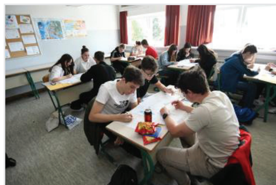
Ekipe su činila tri učenika koji su zajednički rješavali 24 zadatka u 80 minuta.