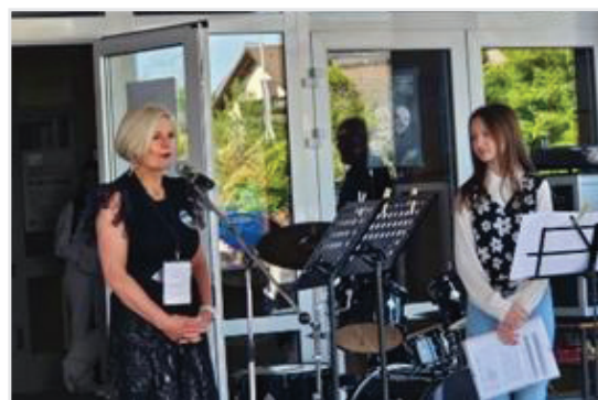
Uz prigodan koncert, predsjednica Matheme 2024 otvorila je natjecanje uz čije se budno oko ono i odvijalo.