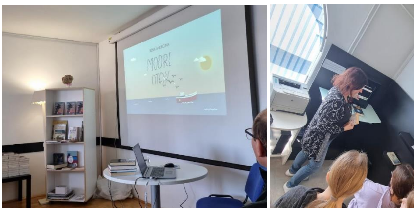
Slika 2: Posjeta Knjižnice Ivančna Gorica u školskog godini 2023./2024.

Domaće čitanje je ključno za razvoj čitateljskih navika, kritičkog mišljenja i osobnog napretka. U usporedbi s čitanjem u školi, koje je često usmjereno na ispunjavanje obrazovnih ciljeva i zadataka, domaće čitanje omogućava slobodan odabir literature i osobno iskustvo, što dodatno povećava užitak u čitanju.