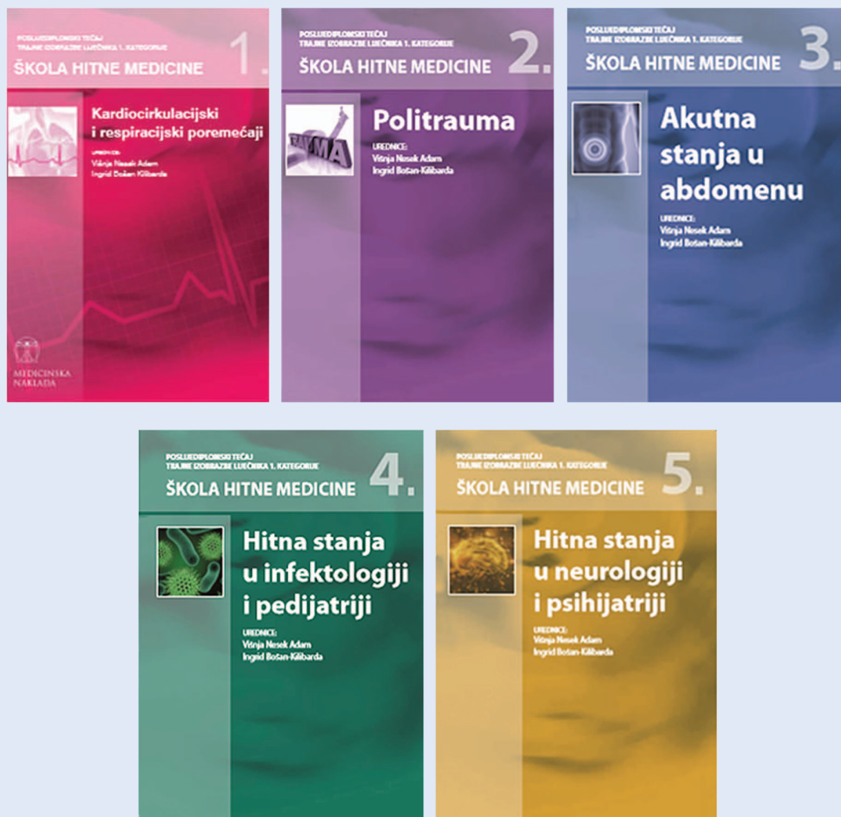
Slika 2. Škola hitne medicine – poslijediplomski tečaj trajne medicinske izobrazbe (5 modula)