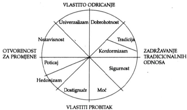
Slika 1. Strukturalni odnosi između 10 vrijednosnih tipova niže razine

Vrijednosti su trajna vjerovanja da je određeni cilj ili način ponašanja, osobno ili društveno, poželjniji od nekog drugog cilja. One su apstraktni ideali koji usmjeravaju ljudsko ponašanje (Fischer, 2017.; Maio, 2010.). Socijalna pravda, sloboda i pomaganje neke su od vrijednosti koje općenito smatramo poželjnim. U ovom radu vrijednosti se sagledavaju u sklopu Schwartzove teorije osobnih ljudskih vrijednosti (Schwartz, 1992.). Teorija razlikuje deset osobnih vrijednosti niže razine, koje se mogu opisati dvjema nadređenim dimenzijama (Schwartz, 2012.). Prva dimenzija višeg reda suprotstavlja vrijednost zadržavanja tradicionalnih odnosa (obuhvaćeni su vrijednosni tipovi sigurnost, konformizam i tradicija) s vrijednosti otvorenost za promjene (obuhvaćeni su vrijednosni tipovi nezavisnost i poticaj). Na drugoj dimenziji suprotstavljene su vrijednosti vlastito odricanje (vrijednosni tipovi univerzalizam i dobrohotnost) i vlastiti probitak (vrijednosni tipovi postignuće i moć). Vrijednosni tip hedonizam istovremeno je povezan i s otvorenošću za promjene i s vlastitim probitkom te se u istraživanjima svrstava u jednu ili drugu dimenziju (Schwartz, 2006.) (Slika 1.).