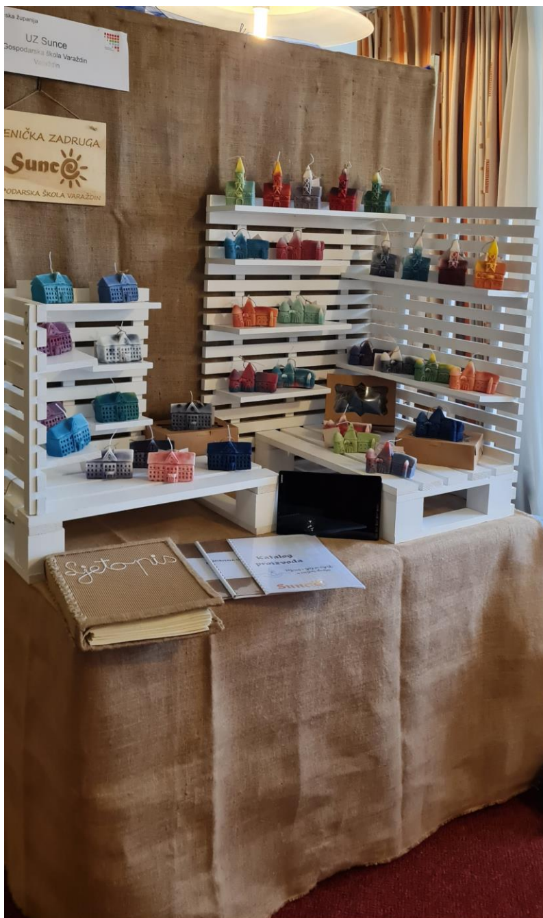
Slika 1. Izložbeni štand učeničke zadruge Sunce