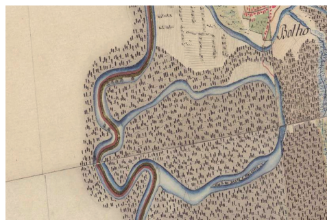
Sl. 2. Husinja 1782. – 1785. (izvor: Karta Ugarskog Kraljevstva (1782. – 1785.) – Prva vojna izmjera, Dostupno na: https://maps.arcanum.com ).

stara korita, to jest, spomenute rukavce od kojih su jedni zadržali vodu, a drugi tijekom vremena presušili. Pritom su u većini slučajeva stradale naplavne obradive površine uz rijeku, tako da je voda znala odnijeti na desetke jutara plodne zemlje i djelomično ih naplaviti negdje nizvodno. Time su najviše bili oštećeni posjednici koji su takoreći preko noći osiromašili ostavši bez zemlje. S ovim prirodnim procesom, poplavama i smirivanjem dravskog toka prijašnje su vlasti imale velikih problema, ali i troška. Prve veće mjere protiv poplava i za nesmetanu plovidbu Dravom poduzete su u 18. stoljeću, premda su pojedini nasipi podignuti i prije. Godine 1780. donesen je prvi projekt sustavnog uređenja rijeke Drave u sklopu kojeg je nastala i hidrografska karta, kasnije nazvana Nacrč Podravlja od Hlebina do medje Virovitičke županije uz oznaku vodogradnja . Spomenu-