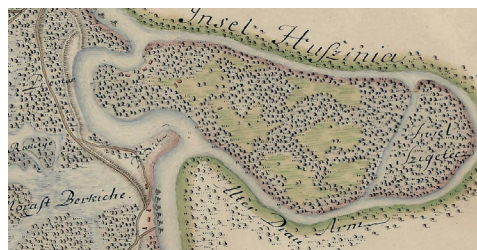
Sl. 1. Husinja 1781. – 1782..

Drava je hirovita rijeka relativno brzog toka i velike mehaničke snage koja je snažno erodirala obale i akumulirala materijal (šljunak, pijesak) u svome koritu, naročito u ovome dijelu. Ona je meandriranjem i razlijevanjem stvarala brojne rukavce, suha korita, močvare, mrtvice, i bereke. Narod je takve rukavce i suha korita nazivao „starom Dravom“, a uistinu je tako. Na ovom prostoru kroz duga razdoblja taložio se šljunak i pijesak pa se riječno korito uslijed erozije uzrokovane snagom vode s vremena na vrijeme često pomicalo ostavljajući iza sebe