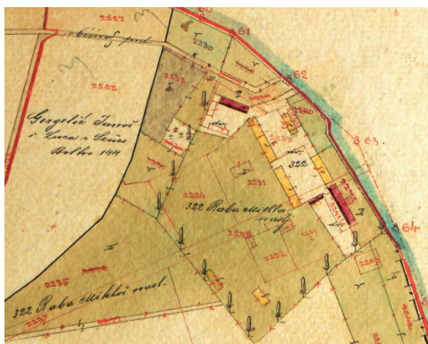
Sl. 8. Kućište obitelji Rába na katastarskoj karti iz 1898. godine.

neposredno uz jarak starog korita dravskog meandra. Jarak danas praktički predstavlja granicu s Mađarskom. Od dravske obale, odnosno skele, sredinom teritorija vodi put ravno do imanja i obiteljske zidanice ispred koje su smješteni ograđeni vrtovi i travnjaci. Uz kuću s lijeve strane nalazi se prostrano gospodarsko dvorište s obje strane omeđeno štagljevima i stajama. Gospodarsko dvorište je pak spojeno s manjim dvorištem u kojem je podignuta još jedna zidanica. Po svemu sudeći u njoj su stanovali zaposlenici na imanju. Spomenuti put obilazi imanje s lijeve strane te iza njega preko dravskog jarka vodi prema Bojevu. Uz jarak iza imanja smješteni su vrtovi. Nešto južnije od manjeg dvorišta, a s desne strane obilazećeg puta leži malo obiteljsko groblje. 22 Prilikom obilaska terena 2014. godine staro korito je još uvijek bilo vidljivo, kao i korito koje je Sigetec dijelilo od ostalog dijela Husinje. Prostor obiteljskog imanja zarastao je orahovim stablima. Zatečen je samo manji dio betonskog temelja,