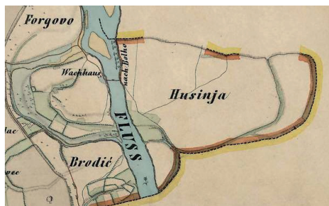
Sl. 6. Husinja 1865. – 1869..