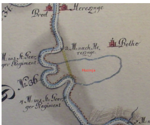
Sl. 3. Husinja 1797. (izvor: Hrvatski državni arhiv, Kartografska zbirka HR-HDA-902, Drau Fluss praeliminar Karte im Jahre 1797., sign. D. XII. 4).