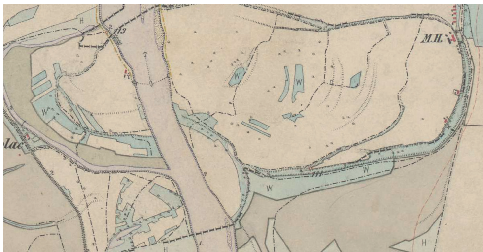
Sl. 7. Husinja 1869. – 1887. (izvor: Habsburško Carstvo (1869. – 1887.), Treća vojna izmjera (1:25000), (Dostupno na: https://maps.arcanum.com ).

ostavilo na lijevoj strani, a manje meandre na desnoj strani obale kod Brodiča. Prodor je očito počeo na mjestu označenom slovom -X- na prethodnoj karti. Jedino nije poznato je li prodor napravila Drava ili je potpomognut hidroregulacijskim radovima. Staro korito oko Husinje očito je suho, ali i dalje predstavlja staru granicu. Na Husinji su vidljivi ucrtani putovi, kao i skela kojom se od predjela Brodiča dolazi do nje. Staro korito s hrvatske strane već je zaraslo u drveće i pretvoreno u obrađivo tlo. 10 Karta treće vojne izmjere izrađena u razdoblju od 1869. do 1887. godine (vidi Slika 7.) na Husinji prikazuje kuće i gospodarske zgrade, staro korito zaraslo drvećem i nekoliko pošumljenih dijelova. Riječ je o imanju veleposjedničke obitelji Rába i još dva manja kućišta, o kojima će biti riječi u daljnjem tekstu. Izgled ovog područja zadržao se sve do danas. 11