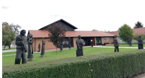
Slika 8. Park skulptura ispred Galerije naivne umjetnosti Hlebine.