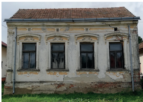
Sl. 5. Tip zidanice, „fronte“, Gajeva ulica, Hlebina, danas zapuštena (, 26. 9. 2022.).

U usporedbi s ostalim selima ovog kraja, u selu Hlebine zadržan je oblik i položaj okućnica te osnovni raspored stambenih i gospodarskih građevina. No, u drugoj polovini 20. stoljeća, nadogradnjama i pregrađivanjima promijenjena je katnost, veličina i oblikovanje građevina. Povećanjem katnosti, povećao se i broj prostorija u kući, pa od prijašnje tri prostorije, kuće dobivaju još nekoliko prostorija. Na mjestu srušenih starijih kuća, grade se nove koje nužno ne prate oblik prijašnje građevine. Promijenjen je materijal i način gradnje ograda okućnice, od prvotnih ograda načinjenih od pletera ili drvenih dasaka kod kuća sa slamnatim krovom, do zidanih ograda s drvenim vratima i drvenom kapijom u produžetku jedinki zidanica, koje su u visini do polovice prednjih prozora. Ograde na današnjim kućama najčešće imaju niski betonski parapet sa stupovima između kojih su nanizani vertikalno postavljeni drveni ili metalni stupići ili su napravljene od pravokutnih