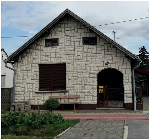
Sl. 6. Primjer obnove zidanice s novim materijalom, Gajeva ulica, Hlebine.

kuće ili u njima najčešće žive stariji članovi obitelji koji nemaju sredstava za održavanje kuće. 29 No, u selu ima i primjera kuća koje su obnovljene u skladu s tradicijskom gradnjom podravskog područja, pri čemu se poštuje oblik i veličina starinske kuće te boja fasade.