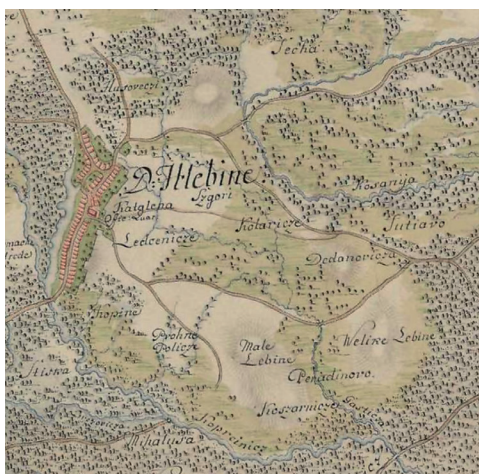
Sl. 1. Karta prve vojne izmjere Habsburške Monarhije (1781. – 1782.), Varaždinski generalat, selo Hlebine ( https://maps.arcanum.com/en/ , pristup 2. 7. 2022.).

binska škola”, koja predstavlja slikare-seljake naivnog izraza iz Hlebina i okolnih podravskih sela, čija je temeljna slikarska načela postavio Krsto Hegedušić. Popularizacijom naive, u Hlebina desetljećima dolaze kupci i galeristi te svi zainteresirani za ovu vrstu umjetnosti, ali i oni koji su željeli vidjeti odakle naiva potječe. U ovom radu prate se prostorne i arhitektonske promjene sela Hlebina od kraja 18., odnosno od 19. stoljeća do danas. Selo je u 20. stoljeću doživjelo specifičnu pojavu koja nije tipična za ostala sela, a to je naivna umjetnost. Naiva je kao „pokret” obuhvatila nekoliko okolnih sela i stotinjak seljaka-slikara, s Hlebinama kao glavnom odrednicom i poveznicom na teritoriju sjeverne Hrvatske. O naivnom slikarstvu i „Hlebinskoj školi” napisane su mnoge knjige i katalozi, a ovaj rad nastoji putem literature, vizualnih materijala i intervjuva prikupiti, iščitati i analizirati podatke u svrhu boljeg shvaćanja promjena kroz koje je prošlo selo Hlebina. 1