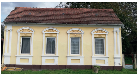
Slika 7. Primjer obnovljene fronte, Ulica bana Josipa Jelačića, Hlebine.