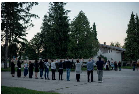
Sl. 2. PLEH, Akcija, 2008. – 2018., 2018.