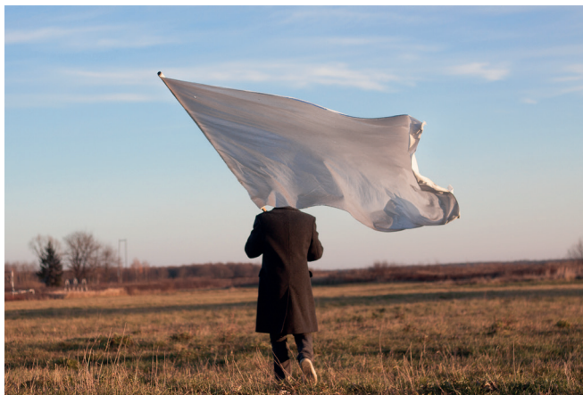
Sl. 6. Kompleksi: (su)život ljudi i prostora: Gildo Bavčević, Balans bijele, 2016.

program djeluje od 2015. godine, a propituje kako se društveno-politički kontekst ogleda u različitim (infra)strukturama te kako se u njima čitaju različiti slojevi povijesti i (izgubljenih) identiteta. Aktivacija prostora potaknuta je umjetničkim djelovanjem i reakcijama na specifičnost prostora koje daju novo očište, nove interpretacije, nove uvide. Od 2015. godine Atelieri Koprivnica postaju dio Foruma udruga nezavisne kulture (FUNK) formiranog također u prostoru Kampusu. 14 FUNK je autonomni centar nezavisne kulture gdje se provode aktivnosti saveza udruga maMUZE, Kopriva, RockLive, Pod Galgama. „Prakse u ostalim gradovima pokazale su kako su prenamijenjeni prostori vojarne idealni za kulturno-društvene centre: time se u isto vrijeme radi na revitalizaciji urbanih prostora koji nisu dovoljno iskorišteni i oživljavaju se gradski punktovi koji su u procesima tranzicije.“ 15 Tranziciju prostora Kampusu svakako pomaže i razvoj Sveučilišta Sjever s kojim AK galerija ostvaruje uspješnu suradnju sa studentima i profesorima Odjela za medijski dizajn čime se ostvaruje veća inkluzija zajednice. Odnedavno se timu AK galerije