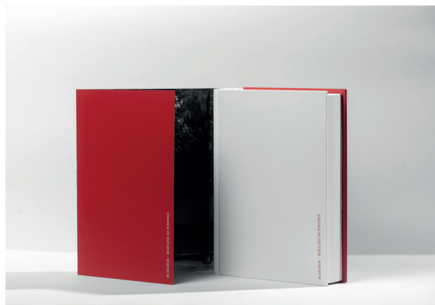
Sl. 7. AK galerija – Desetljeće na periferiji, knjiga