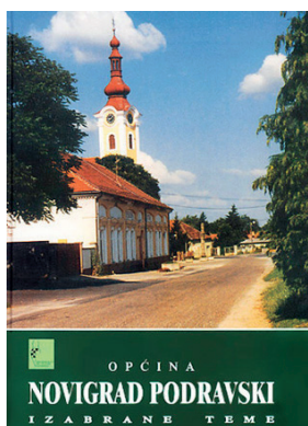
Sl. 5. Naslovnica jedne od brojnih monografija posvećenih gradovima i općinama – Općina Novigrad Podravski.