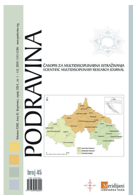
Sl. 6. Naslovnica časopisa Podravina broj 45 iz 2024. godine.

priloga. Dužnost zamjenika i/ili pomoćnika urednika obnašali su Branko Kladarin, Stjepan Škramić, Alan Čaplar, i Hrvoje Dečak. Članovi uredništva, uredničkog vijeća i/ili stručnog savjeta tijekom 30 godina izlaženja časopisa bili su mahom ugledni hrvatski geografi i povjesničari.