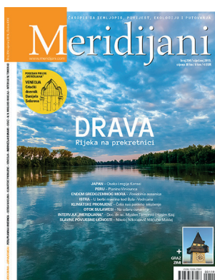
Sl. 1. Naslovnica časopisa Meridijani iz siječnja 2019. godine.