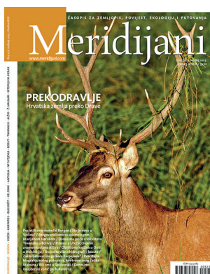
Sl. 3. Jedan od brojeva časopisa Meridijani iz 2023. godine bio je posvećen Prekodravlju.

životinjama, posebno onima ugroženima i karakterističnim za hrvatske krajeve.