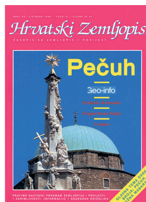
Sl. 2. Naslovnica časopisa Hrvatski zemljopis (preteče Meridijana) iz listopada 1999. godine.

država tada još nije imala, čak ni u obliku licenciranih stranih izdanja, od kojih su neka došla puno kasnije (u međuvremenu su i ugašena zbog slabe prodaje jer se Hrvatska pokazala kao premalo tržište).