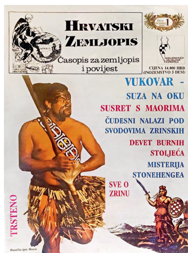
Sl. 7. Naslovnica prvog broja časopisa Hrvatski zemljopis.

To vrijedi i za časopis Meridijani koji gotovo u svakom broju nastoji objaviti rad barem jednog novog autora ili fotografa. Vrijednost ostalih znanstvenih časopisa koje izdaju Meridijani, osobito časopisa Podravina, jest u tome što okupljaju znanstvenike i unapređuju istraživanja na cijelom prostoru porječja rijeke Drave (od Dolomita do Dunava), s težištem na gornju hrvatsku Podravinu. Časopis Podravina jedan je od najcjelovitijih regionalnih znanstvenih časopisa u kojem je dosad objavljeno više od 400 znanstvenih radova, ima najveću kategorizaciju – A1, a razmjenom i suradnjom prisutan je u mnogim zemljama Europe i svijeta. Referira se u nekoliko svjetskih baza, među kojima i u Scopusu. Na kraju, Meridijani su organizirali i brojna javna predstavljanja knjiga i časopisa, događanja, predavanja i tribine, natječaje („Pišite o zavičaju“, foto natječaje, nagrade za najbolje maturlne radnje iz geografije i sl.), čime su dodatno obogatili kulturni i znanstveni život Hrvatske. Ukratko, tijekom tri desetljeća uspjeli su ostati relevantni te su se prilagodili promjenama u društvu (prisutni su i na društvenim mrežama Facebooku i Instagramu), sve