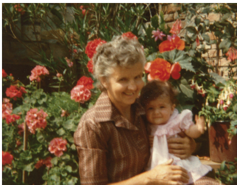
Sl. 3. Obiteljska fotografija iz Brežanca – baka Grosa s unukom.

nastalog uzimajući u obzir sve uključene. Prilikom istraživanja, tehnologija se predstavlja kao dobar način za kombinaciju povijesnih elemenata i ostavštine te suvremenih praksi koje će u ovom mediju zabilježiti, predstaviti i sačuvati priče i dati posebnu važnost (radu sa) stanovnicima.