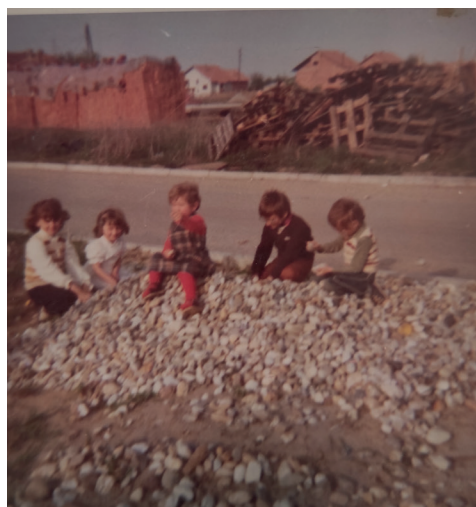
Sl. 5. Lenišće u vrijeme izgradnje.

SVILARSKA. Zakulisje glavnog trga, ulica koja prihvaća raznolikosti, jednako cijeni