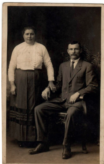
Sl. 4. Iz obiteljskog albuma: par koji je Karpatijom putovao u Ameriku.