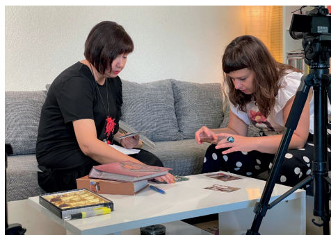
Sl. 1. Pregledavanje fotografija tijekom jedne od akcija.

Program je uključio nabavu malog putujućeg studija za snimanje i edukaciju voditeljica programa o osnovama rukovanja opremom, kadriranja, snimanja i montaže u kojoj je kao predavač sudjelovao Dinko Šimac, koprivnički redatelj, snimatelj i producent. Istovremeno se radilo na planu akcija u kojima će se snimati sugovornici te je napravljen vizualni identitet programa, a njegov je autor domaći grafički dizajner Dejan Halusek. On je i autor rješenja stranice na kojoj se u digitalnom obliku mogu pregledavati prikupljene priče. Slijedila je velika uvodna kampanja i poziv stanovnicima Koprivnice da se prisjete zanimljivih priča u svom kvartu, donesu fotografije, da sami ili u suradnji s nama dokumentiraju današnje stanje, posebnosti pojedinih ulica, da kritički i kreativno razmišljaju. Tijekom godine u dvodnevnom su se akcijama u svakom kvartu prikupljali predmeti za fotografiranje, zapisivale su se priče, napravili intervjui s kazivačima, a sve se arhiviralo i predstavljat će se na stranici projekta. Mnogi danas svakodnevno koriste