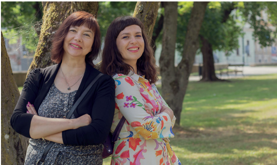
Sl. 6. Voditeljice Skrivenog lica Koprivnice.

više ljudi, najzanimljivije zgrade i u kojem se umjetnost u javnom prostoru cijeni i koristi na načine kako su to zamislili umjetnici. Tarašnice su kao razvijeni produžetak centra jedan od kvartova koji okuplja možda i najveći broj ljudi u stambenim zgradama, a neke od njih su sugovornici opisali kao toliko posebne da nigdje nisu vidjeli slične. Vrtić, škole i miris čokolina ili pekmeza uz veliki su broj dnevnih migracija glavna odrednica kvarta koji živi punim plućima u dobrosusjedskim odnosima i toplini kvartovskog života.