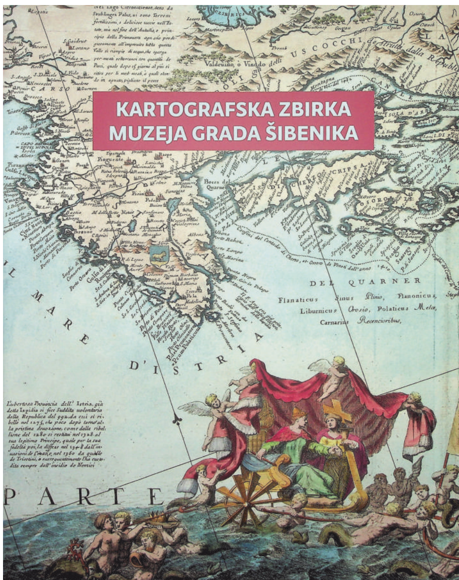
Catalog cover featuring a detail from Coronelli's map of Dalmatia, depicting an allegorical representation of Venice as the mistress of the Adriatic Naslovnica Kataloga s isječkom Coronellijeve karte Dalmacije na kojoj je u prvom planu alegorijski prikaz Venecije kao gospodarice Jadrana