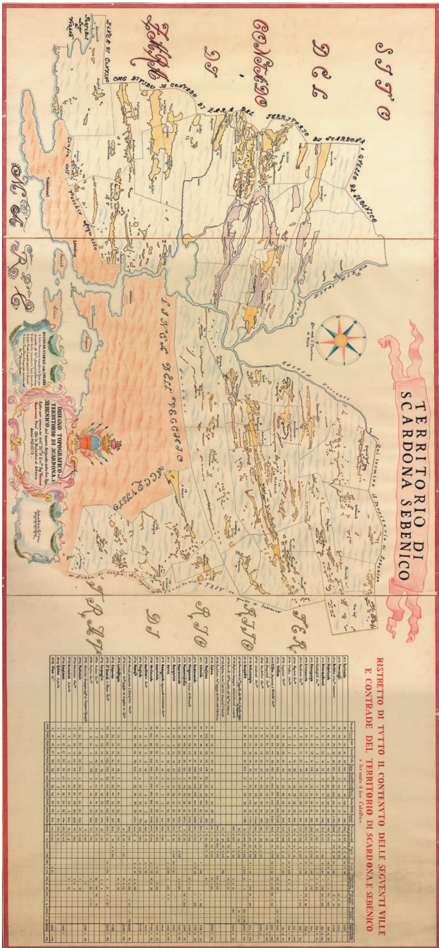
Nepoznati autor, Karta skradinskog teritorija, Zadar, 1709.