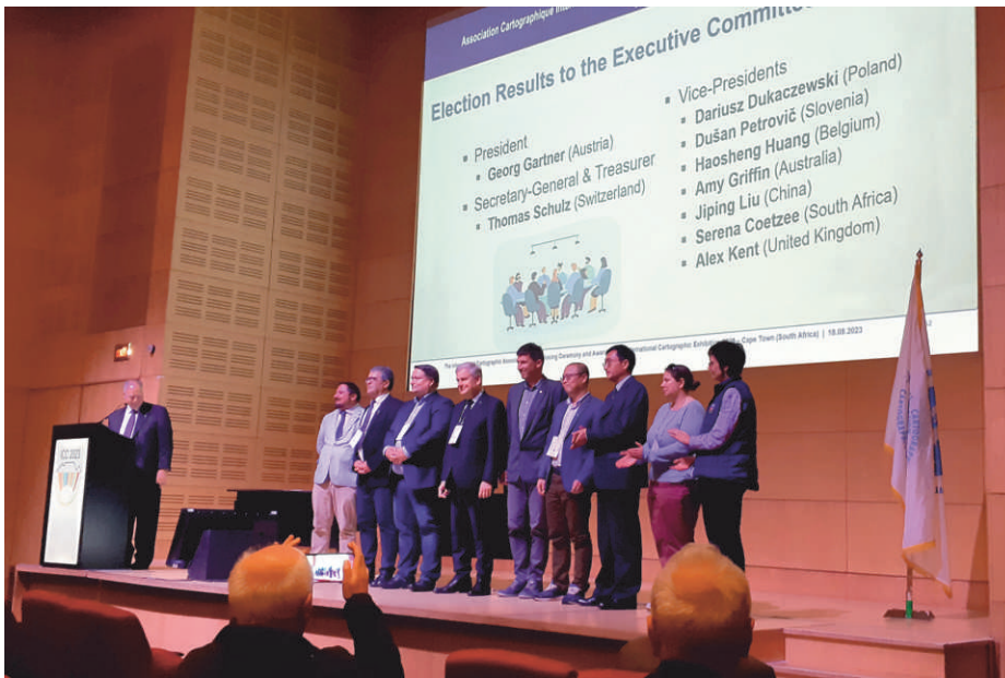
Executive Committee ICA/ACI Novoizabrano vodstvo ICA/ACI

Cape Town, South Africa, 13th – 18th August 2023