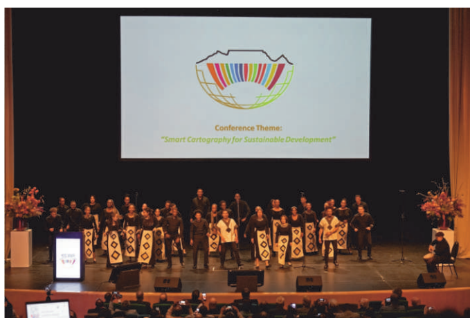
Opening ceremony Scena s otvaranja konferencije

imaginatively taught us about the role of cartography in relation to warning about the unavoidable consequences of the global climate change. All the Commissions and ICA Working Groups convened at the assembly, some of them holding workshops prior to the conference.