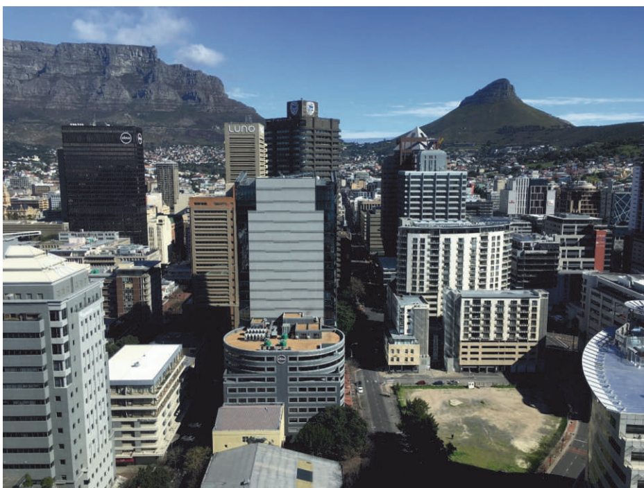
Pogled na središte Cape Towna s prepoznatljivom Lavljom glavom (desno) i Stolnom planinom (lijevo)

Prvog i posljednjeg dana konferencije nacionalni predstavnici okupili smo se na 19. ICA/ACI generalnoj skupštini. Usvojili smo dosta izmjena i dopuna statuta, a uz usvajanje izvješća i razmatranja programa rada za naredno razdoblje, izabrali smo i novo rukovodstvo.