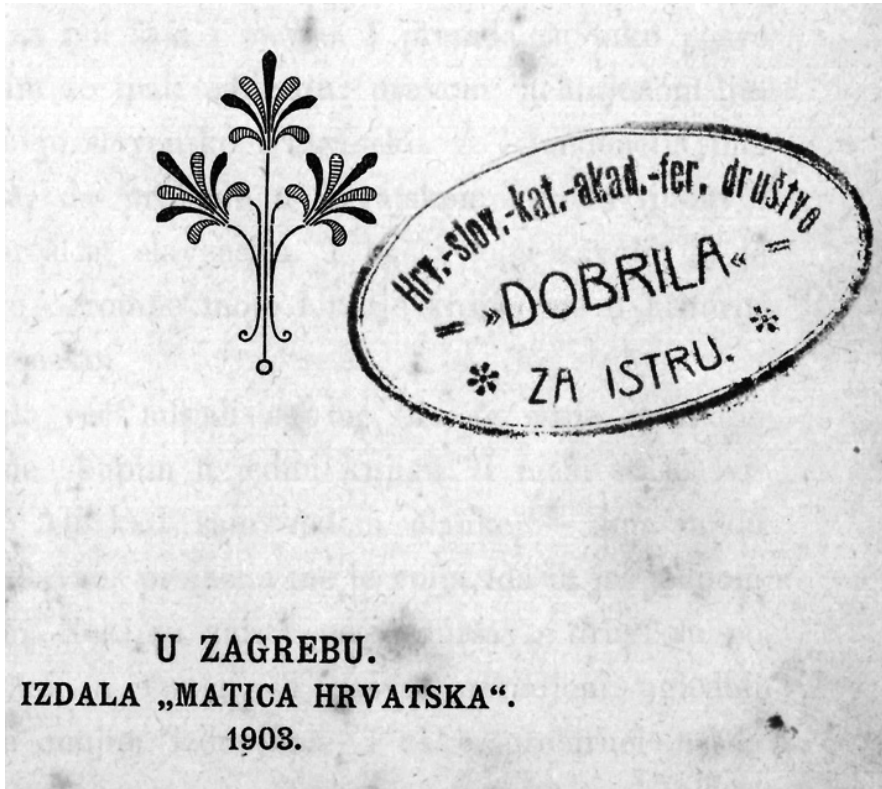
Sl. 1. Naslovnica knjige Vjekoslava Klaića Slike iz slavenske povjesti s pečatom Akademskoga hrvatsko-slovenskoga katoličkoga ferijalnog društva Dobrila (u vlasništvu autora)