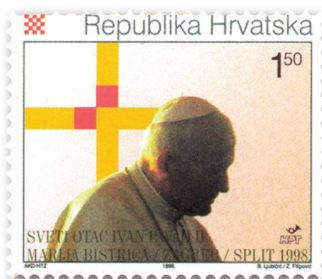
Slika 12 Marka u povodu drugoga pohoda Ivana Pavla II. Republici Hrvatskoj

Papa Ivan Pavao II. pohodio je hrvatski narod i Crkvu u Hrvata pet puta: tri puta u Hrvatskoj (1994., 1998., 2003.) i dva puta u Bosni i Hercegovini (1997., 2004.). 56 Hrvatska pošta i telekomunikacije, odnosno Hrvatska pošta, obilježila je njegove pohode prigodnim izdanjima, 57 a