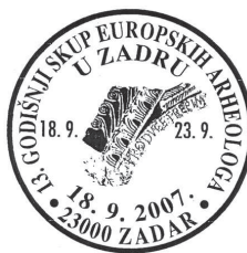
Slika 7 Prigodni žig povodom Trinaestoga skupa europskih arheologa u Zadru

Na omotnici prvoga dana sve tri su marke i to slijeva Pilarova, Bulićeva te Šercerova. Žig je okrugla oblika, a