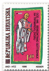
Slika 3 Marka u spomen 1150 godina od boravka benediktinca Gottschalka na dvoru kneza Trpimira

Na omotnici su dvije marke, 30 već opisana s Gottschalkovim likom te druga, iz istoga niza, posvećena obilježavanju 900 godina Večenegina evanđelistara. 31 Žig