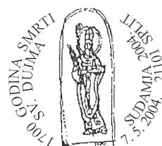
Slika 22 Prigodni žig u pošti 21001 Split

njegovim je grobom podignuta bazilika. Poslije su mu kosti prenesene u Split, a relikvije u kapelu sv. Venancija u krstionici Lateranske bazilike u Rimu. Sv. Dujam zaštitnik je Splita, a slavi se 7. svibnja jer nadnevak njegove smrti – rođenja za Nebo – 10. travnja često pada u korizmu. 81