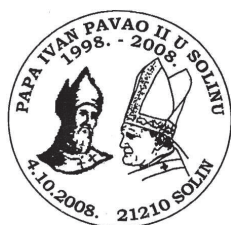
Slika 14 Žig kojim je obilježena deseta obljetnica Papina pohoda Solinu