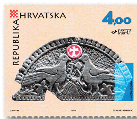
Slika 1 Marka u povodu Trinaestoga kongresa za starokršćansku arheologiju

Na marki je luneta portala starokršćanske crkve u Gati- ma s prikazom Uskrsnuća i Silaska u Limb, što je svojstveno likovnom govoru 6. stoljeća i izražava osnovnu ideju kršćanskoga vjerovanja. O tome piše Jasna Jeličić-Radonić: »Reljef je izveden u obliku lunete i uokviren bordurom od niza srcolikih listića. Prostorom dominiraju dvije anti- tetički postavljene golubice između kojih je u središnjem