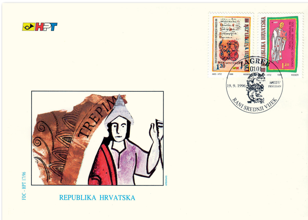
Slika 4 Omotnica prvoga dana u povodu 1150. obljetnice Gottschalkova boravka na Trpimirovu dvoru