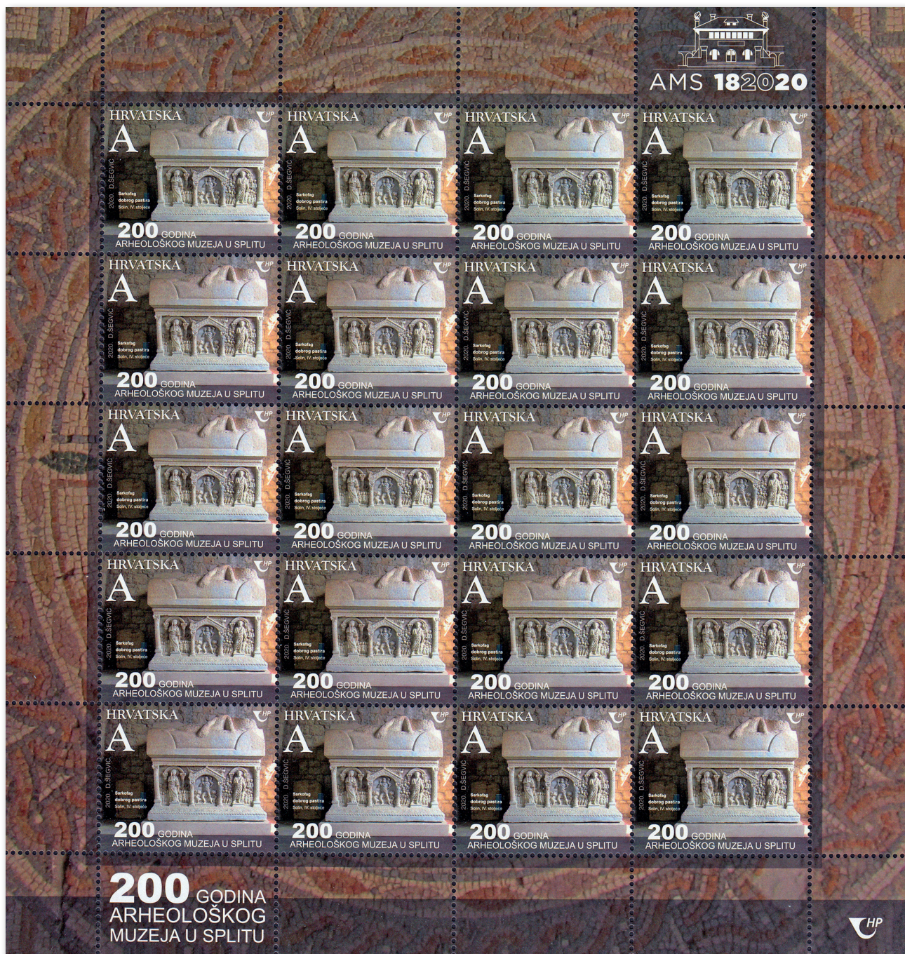
Slika 25 Arak s markama na kojima je sarkofag Dobroga pastira

Dobroga pastira, najpoznatijega spomenika koji se čuva u Muzeju, a koji potječe s Manastirina u Solinu. Prednja strana sarkofaga podijeljena je na tri polja; u sredini je Dobri pastir s ovcom na ramenima, lijevo žena s djetetom, desno muškarac sa svitkom, oboje okruženi skupinom ljudi.