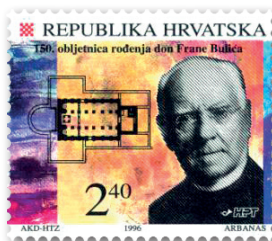
Slika 8 Marka u spomen 150. godišnjice rođenja don Frane Bulića

ponavlja se dvaput jer svaka marka mora biti žigosana. U njegovu gornjem dijelu stoji tekst Obljetnice hrvatske znanosti / Zagreb / 10101 , u donjemu Prvi dan / 4. 10. 1996. , a u središnjemu su portreti trojice znanstvenika te ispod svakoga pripadajući tekst: geolog Gjuro Pilar / otorinolaringolog Ante Šercer / don Frane Bulić . U gornjemu lijevom kutu omotnice logotip je HPT-a, a u donjemu dijelu motiv s piramidalnoga četverostranog ciborija iz predromaničke crkve sv. Marte u Bijaćima, koju je godine 1902. započeo istraživati Bulić. Na crtežu je stranica ciborija ukrašena geometrijskom pleternom dekoracijom i prikazom pauna s grozdom u kljunu. Uz rub arkade je epigrafičko polje s djelomično sačuvanim natpisom. Iznad crteža ponavlja se tekst Obljetnice hrvatske znanosti , a ispod Republika Hrvatska (sl. 9). 45