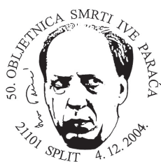
Slika 30 Žig u povodu 50. obljetnice smrti Ive Paraća