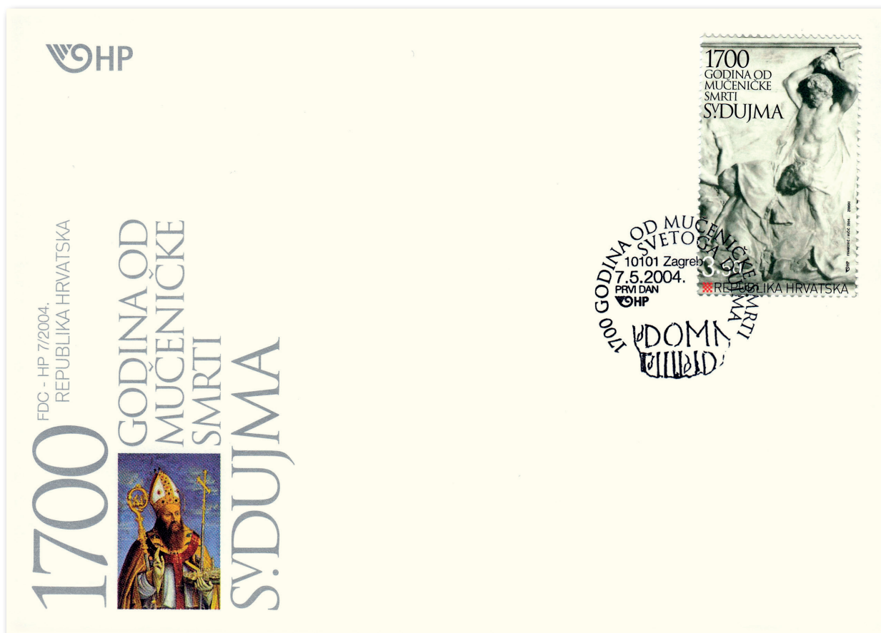
Slika 19 Omotnica prvoga dana posvećena 1700. obljetnici smrti sv. Dujma