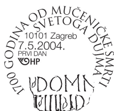
Slika 20 Žig prvoga dana u pošti 10101 Zagreb