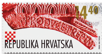
Slika 5 Marka u povodu 1150 godina Trpimirove darovnice

Gottschalk je nakon boravka na Trpimirovu dvoru otputovao u Panoniju i Norik, a nakon toga se vratio u Njemačku, gdje je na crkvenim saborima osuđen zbog širenja hereze. Lišen je svećeničke časti i zatvoren u samostansku tamnicu te je bio prisiljen uništiti sve svoje spise o predestinaciji. 35