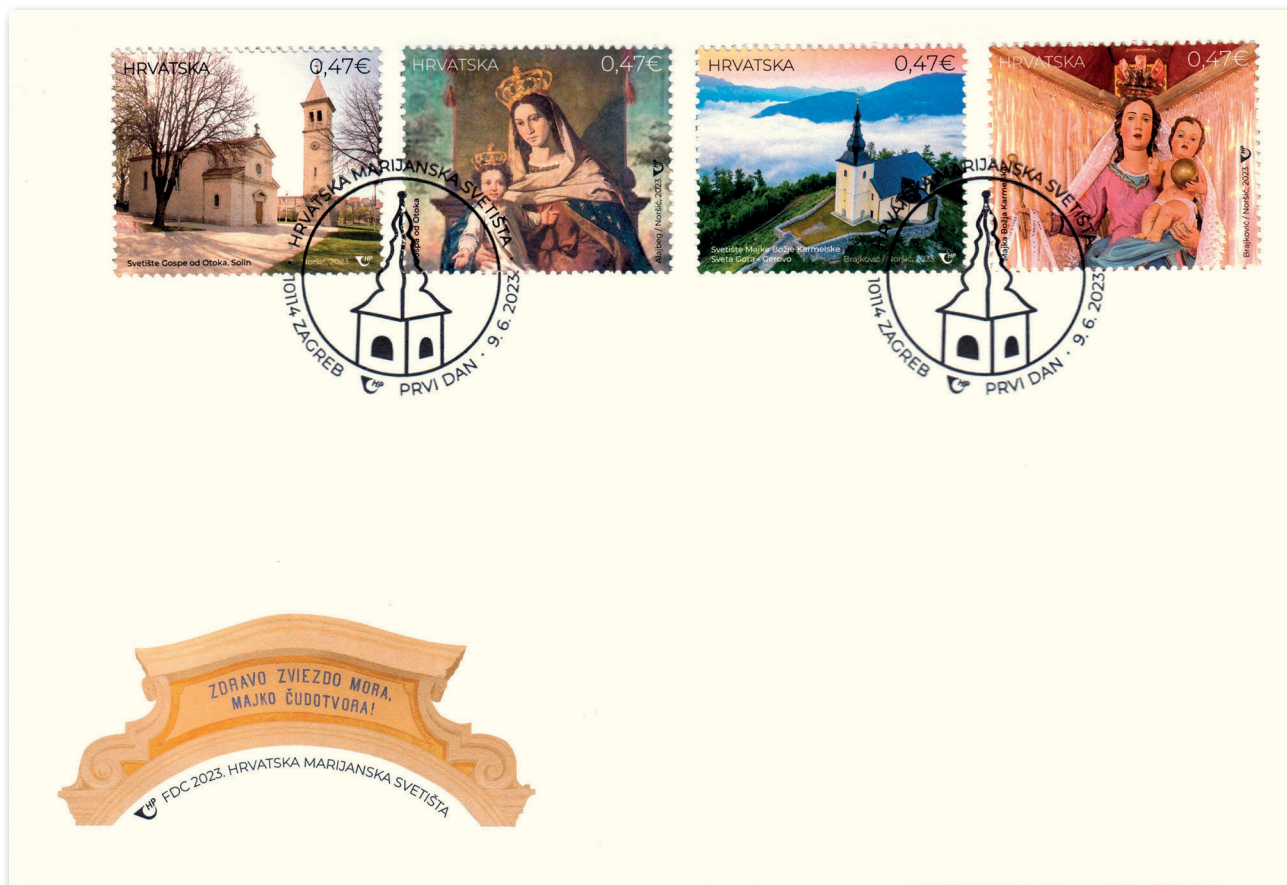
Slika 29 Omotnica prvoga dana iz niza Hrvatska marijanska svetišta