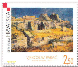
Slika 16 Marka sa slikom Vjekoslava Paraća Ruševine amfiteatra

U sedmome nastavku niza Hrvatsko moderno slikarstvo Hrvatska je pošta godine 2001. izdala marku s reprodukcijom slike Vjekoslava Paraća Ruševine amfiteatra iz godine 1953., što je otisnuto u njezinu donjem dijelu. U istome nizu izdane su marke s reprodukcijama djelâ Slavka Šohaja i Lea Juneka, a svaka je tiskana u arcima od 12 maraka. Izdana je i prigodna omotnica prvoga dana. Autor maraka i omotnice je Daniel Popović, dizajner iz Zagreba. Vrijednost marke je 2,50 kn; veličina 42,60 x 35,50 mm; papir bijeli, 102 g, gumirani; zupčanje 14, češljasto; tisak