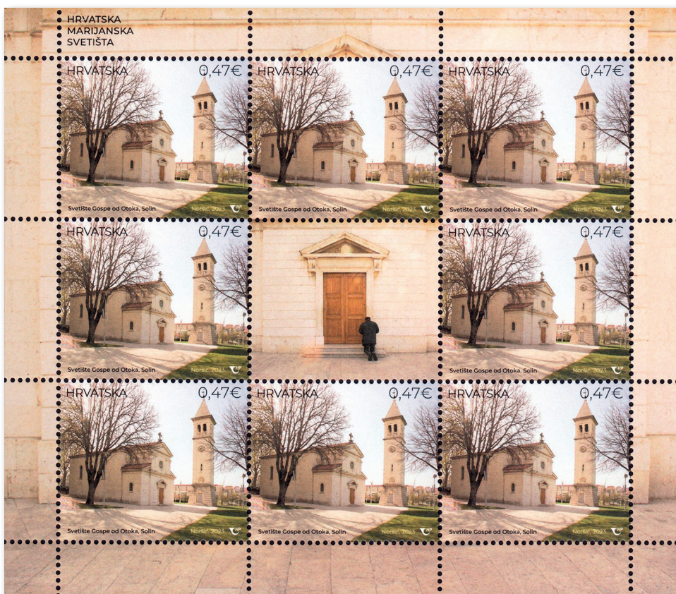
Slika 27 Arčič s markama i privjeskom na kojima je prikaz crkve Gospe od Otoka

Gospino prasetište pohodio je i papa Ivan Pavao II. u sklopu svoga drugog pohoda Republici Hrvatskoj. 104