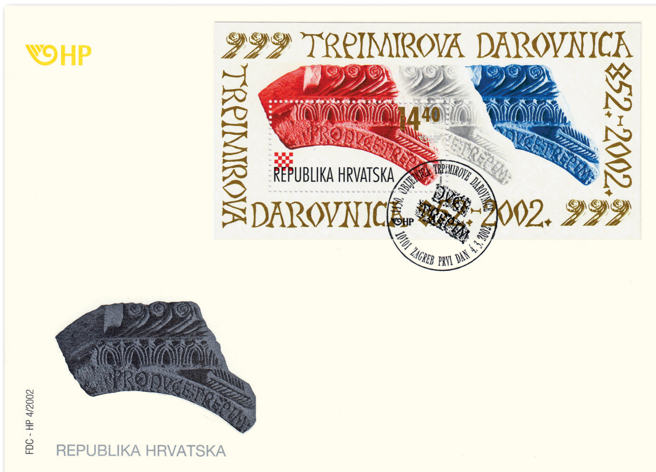
Slika 6 Omotnica prvoga dana u povodu 1150 godina Trpimirove darovnice

colla trementes . U prijevodu: »Za kneza Trpimira Kristu podastrite molitve i u strahu prignite vrat.« 38 Otkriće prvoga ulomka godine 1891. bilo je povodom arheoloških istraživanja u Rižinicama koja s većim prekidima traju od 1895. do danas. Nađeni su ostatci samostana s crkvom te grobovima od antičkoga razdoblja do novoga vijeka. Jednobrodna crkva široke polukružne apside i maloga broda podignuta je ponad starokršćanskoga oratorija, a njezine dimenzije i organizacija prostora napućuju na namjenu manjoj redovničkoj zajednici – benediktincima.