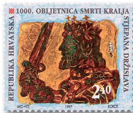
Slika 10 Marka u spomen 1000. godišnjice smrti kralja Stjepana Držislava

Izdavanjem prigodne marke, omotnice prvoga dana i lista prvoga dana HPT je obilježio 1000 godina od smrti kralja Stjepana Držislava. Na marki je Držislavovo poprsje okrenuto nalijevo, na glavi mu je kruna na kojoj se ističu tri križa, a u uzdignutoj desnici mač. Iznad oštrice mača stoji brojka 1000. Autor je Eugen Kokot, akademski slikar iz Zagreba; vrijednost 2,40 kn; veličina 35,5 x 29,82 mm; papir bijeli, 102 g, gumirani; zupčanje 14, češljasto; tiskak višebojni ofset; tiskara AKD, Zagreb; nadnevak izdanja 3. srpnja 1997.; naklada 350.000 primjeraka (sl. 10). U nizu Hrvatski kraljevi HPT je izdao i marku povodom 900 godina smrti Petra Svačića, posljednjega vladara »narodne krvi«. Obje su tiskane u arcima od 20 maraka. 48