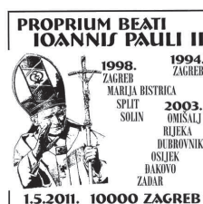
Slika 15 Prigodni žig u povodu beatifikacije Ivana Pavla II.