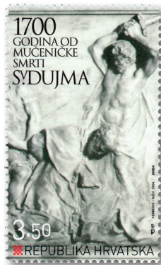
Slika 18 Marka s prikazom mučeništva sv. Dujma

Osim već opisanoga žiga HP je izradio još dva prigodna žiga. Prvi je bio u uporabi 10. travnja 2004. u poštanskom uredu 21210 Solin. Uz gornji rub ide tekst