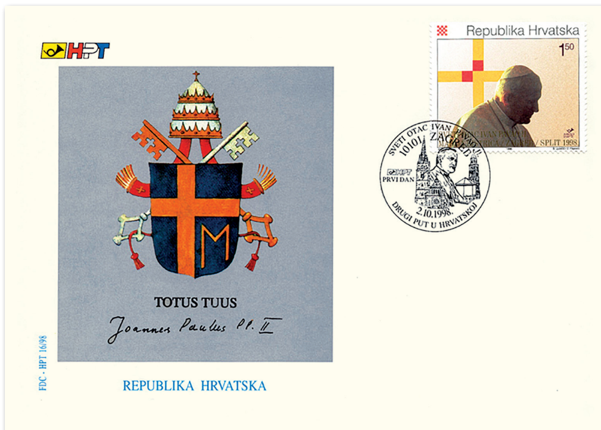
Slika 13 Omotnica prvoga dana u povodu Papina drugog pohoda Hrvatskoj