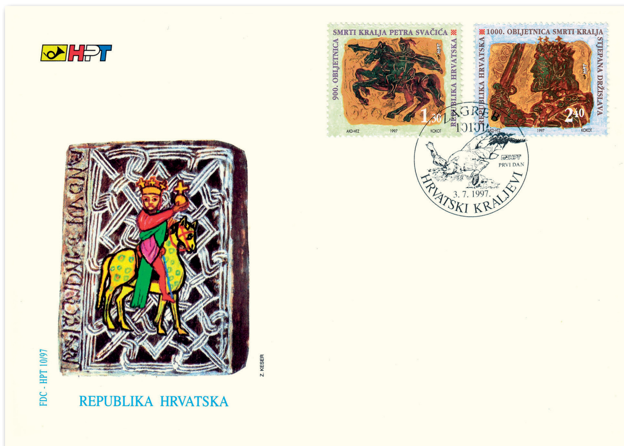
Slika 11 Omotnica prvoga dana iz niza Hrvatski kraljevi

Na omotnici su obje marke. Žig je okrugla oblika, u njegovu gornjem dijelu stoji Zagreb / 10101 , u donjemu Hrvatski kraljevi . Središnji je motiv je detalj sa slike Otona Ivekovića Smrt Petra Svačića , desno je logotip HPT-a s oznakom Prvi dan , ispod nadnevak 3. 7. 1997. U gornje-mu lijevom kutu omotnice logotip je HPT-a, a u donjemu