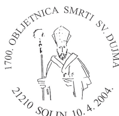
Slika 21 Prigodni žig u pošti 21210 Solin