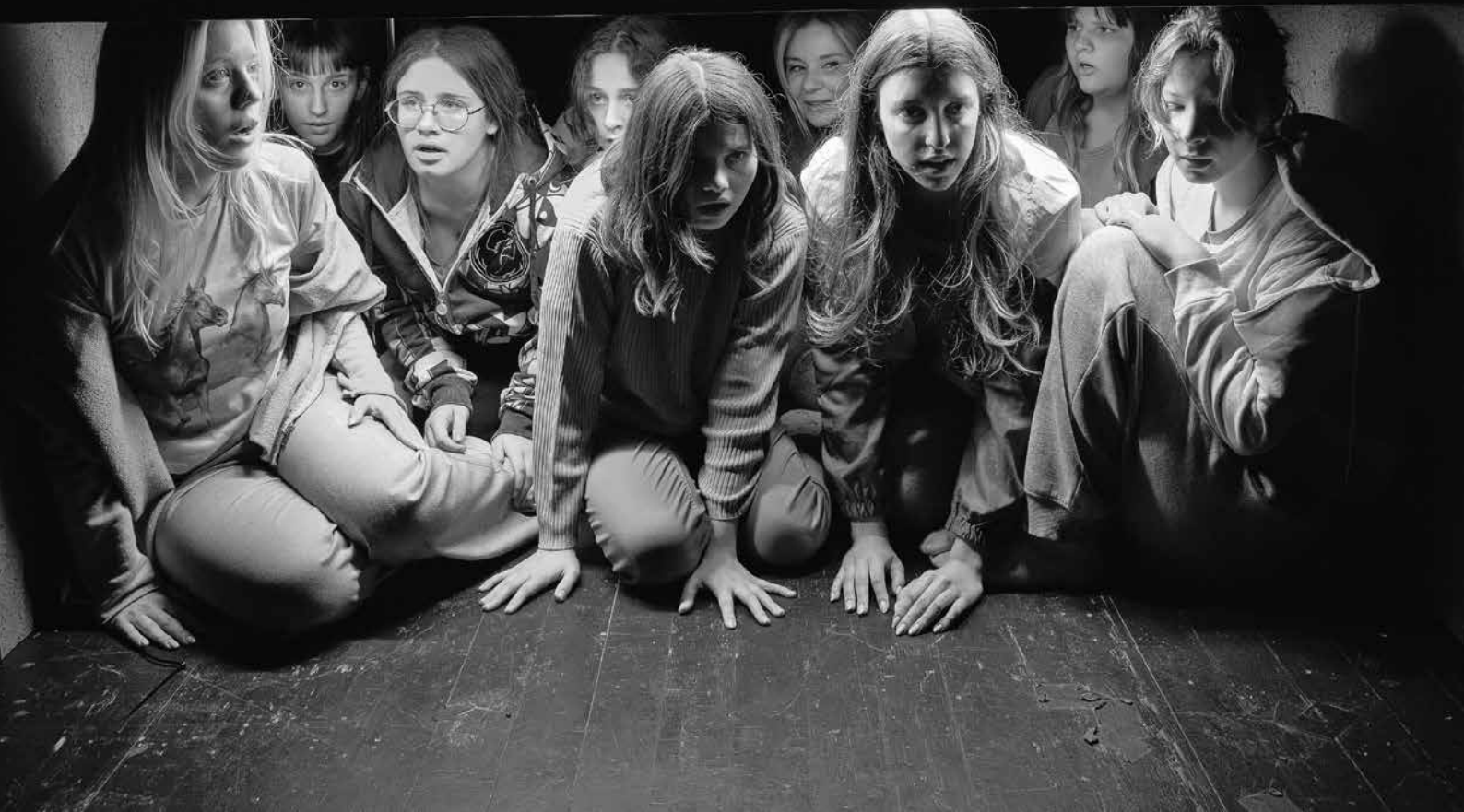
> Anđeo od leda, ZKM, 2024.

drugima? Zanimamo li jedni druge samo kad smo zabavni? I to dolazi iz obitelji. Ako me moji roditelji nisu bili sposobni slušati, cijeli ću se život dokazivati kako bih pokazao da postojim. Koliko ljudi tako živi! Biti ono što jesi – to nije dovoljno. S tom logikom mnogi se dokazuju i zato se moraju pretvarati. Zbog toga se pretvaramo i u kazalištu. A za mene je najveća glumačka kvaliteta kad glumac dođe na pozornicu i samo sjedi i sluša i nema potrebu ništa drugo raditi. To je sve. Možeš sjediti i promatrati ljude – za mene je taj tip smirenosti dokaz profesionalnosti. Svi mogu na pozornici vrištati i gestikulirati, na to smo naviknuti. Mnogo ljudi time dokazuje da postoji i u tome nema razlike između naših privatnih života i kazališta. Ako se svaki dan