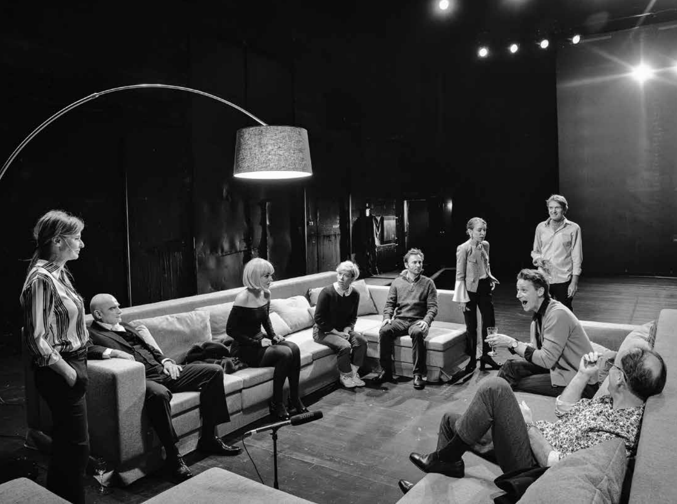
> Anđeo od leda, ZKM, 2024.

Kojim god temama se bavio, Schilling ih u predstavama postavlja u kontekst jedne obitelji. Osvrnemo li se na dvije predstave koje je radio u Zagrebačkom kazalištu mladih, na Pansion Eden i Anđeo od leda , primijetit ćemo da pozornicom dominira kuhinjski stol, jer se za stolom najčešće događa obiteljska dinamika. U obje predstave idilična obiteljska situacija počinje se narušavati otkrivanjem tajni – u Pansionu Eden riječ je o krijumčarenju ljudima i korupciji, a u Anđelu od leda o seksualnom uznemiravanju i odbacivanju. Clara nosi ožiljke očeve pohote i majčine šutnje, a Diego ožiljke majčine emocionalne zatvorenosti i hladnoće nakon smrti mlađega brata. Oboje su odrasli bez odgovarajuće