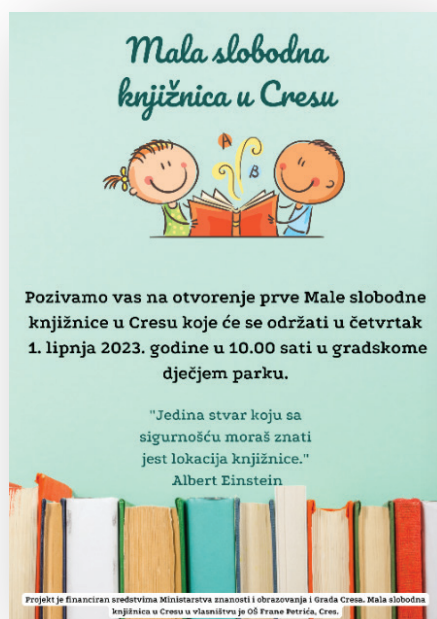
Slika 8. Promotivni materijal – plakat

Korisnike projekta i ostale zainteresirane o fazama projekta obavještavali smo putem mrežnih stranica škole. O otvorenju Male slobodne knjižnice u Cresu obavijestili smo učenike i učitelje usmenim putem u školi, a pozivnice smo dostavili predstavnicima Grada Cresa, turističke zajednice i ravnateljima predškolske i kulturne ustanove na području grada. Lokalnu zajednicu obavijestili smo plakatom kojeg su izradili Mladi knjižničari i postavili ga na oglasnoj ploči Grada Cresa nekoliko dana prije otvorenja.