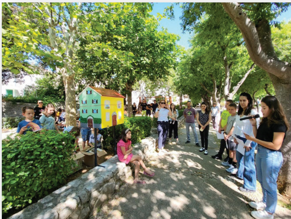
Slika 11. Svečano otvorenje knjižnice.