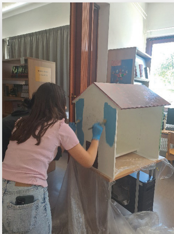
Slika 2. i 3. Projektne aktivnosti

Nakon izrade, kućice Male slobodne knjižnice smještene su u gradskome dječjem parku i u dvorištu zgrade Dječjeg vrtića Girice. Postavljanjem kućica na navedena mjesta pridonosi se kvaliteti odgoja i obrazovanja i promicanju čitanja na otvorenom prostoru od najranije dobi. Također, potiče se nastava na otvorenom u prirodi i na svježem zraku, uz