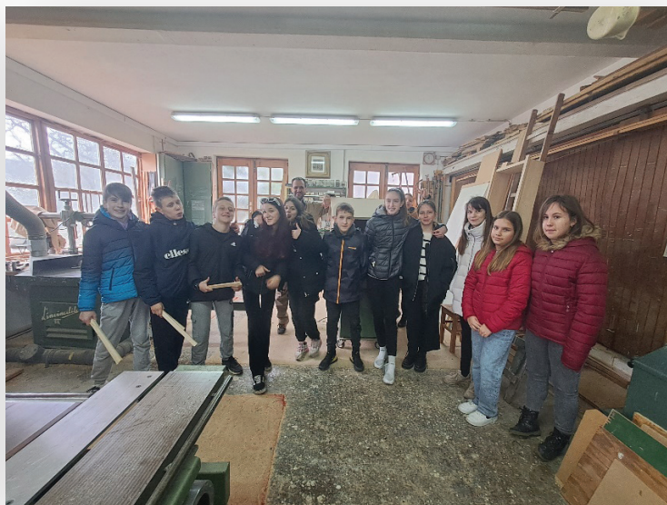
Slika 4. i 5. Projektne aktivnosti