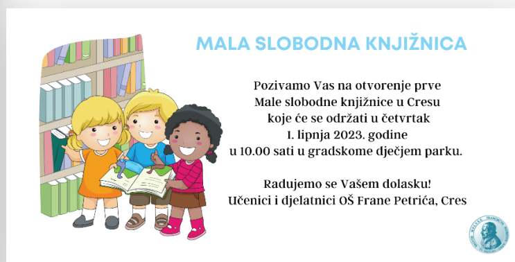
Slika 9. Promotivni materijal – pozivnica

Svečano otvorenje knjižnice održalo se 1. lipnja 2023. godine u gradskome dječjem parku na Šetalištu 20. travnja. Uz prigodan program, vrijedni učenici i djelatnici otvorili su prvu Malu slobodnu knjižnicu u Cresu . Učenici prvog razreda knjigama su popunili prazne police, a zatim su im učenici osmog razreda čitali priče i bajke. Na događaju su bili nazočni i predstavnici Grada Cresa, Turističke zajednice te Dječjeg vrtića Girice.