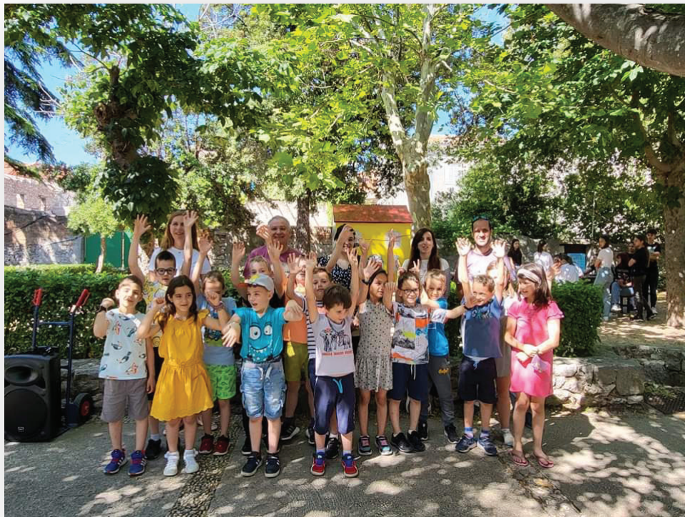
Slika 10. Svečano otvorenje knjižnice.