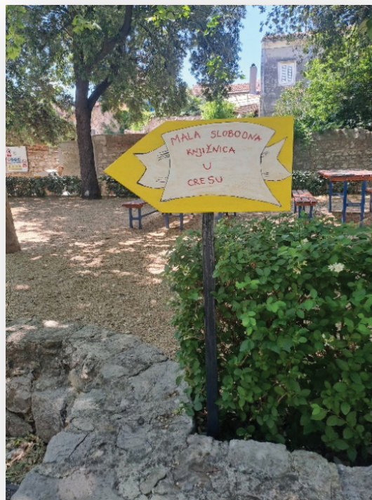
Slika 6. i 7. Mala slobodna knjižnica u Cresu