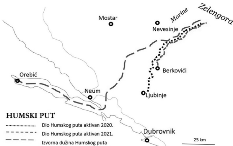
SLIKA 2. Karta Humskog puta s jednom granom najduže izvorne staze i dvije aktivne staze praćene 2020 i 2021.

U Humini se do početka 20. stoljeća mogao još naći nomadizam, prvobitni oblik stočarstva (Dedijer 2017). Prakticirali su ga stočari islamske vjeroispovijesti, “travari” (Dedijer ih zove Balije) iz okolice Ljubuškog i iz Podveležja. Oni su do dolaska austrougarske uprave u Bosnu i Hercegovinu rušili ograde što ih je sve veći razvoj zemljoradnje podizao pred njima, a početkom 20. st. postupno prelaze na zemljoradnju, zanat i trgovinu (Dedijer 2017). Naročito se bave sadnjom duhana i, premda su obrađivane zemlje imali malo, prihodi od zemljoradnje su im premašivali prihode od stočarstva (Kanaet 1960).