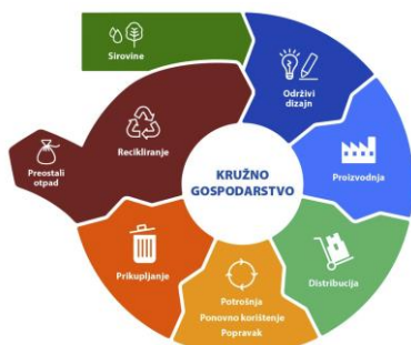
SLIKA 2. MODEL KRUŽNOG GOSPODARSTVA