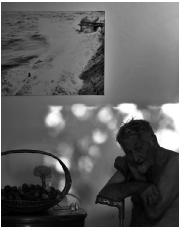
Sl. 3. Portret Krešimira Stanišića

Tim jednostavnim riječima Krešimir Stanišić oslikava svoj životni kroki (fran. croquis ) naglasivši samo ono suštinsko i njemu bitno. Za sve ostale koji su ga poznavali treba ovoj njegovoj skici dodati ono sublimno, ono što njega samog određuje kao pjesnika, kreativca, mislioca, satiričara, "senjskoga fakina" i "dešpetljivca", duhovita i osebujna čovjeka. Kao njegovi tipični senjski "redikuli" i vagabundi i on je duboko ukorijenjen u autentičnu rodnu sredinu i jednako je snažno osjećao život u svim njegovim manifestacijama, od radosti, nostalgije, ljubavi, sjete do "bodljikave zbilje", dvoličnosti i boli.