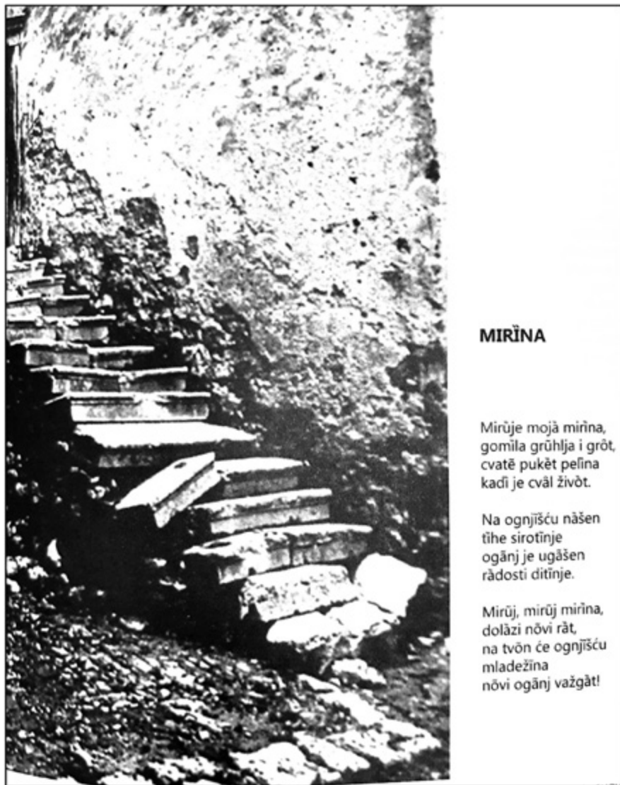
Sl. 4. Antologijska pjesma Mirūna ( Porat uspomenov , 2016.)

se rodi ideja, nosim je kao neki naboj koji poput određene eksplozije rađa zapis. Ja pišem polako tako da mogu putem svojih pjesama komunicirati s ljudima kojima je poezija namijenjena, ali i na taj način zaustaviti tu čakavsku besedu. Često se koristim i tipičnim senjskim humorom."