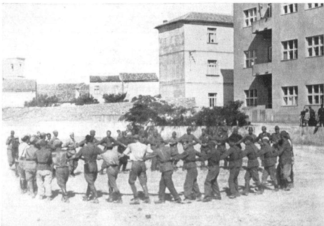
Borci IV bataljona XI udarne dalmatinske brigade igraju kolo ispred Đačkog doma u Krku nakon oslobođenja grada