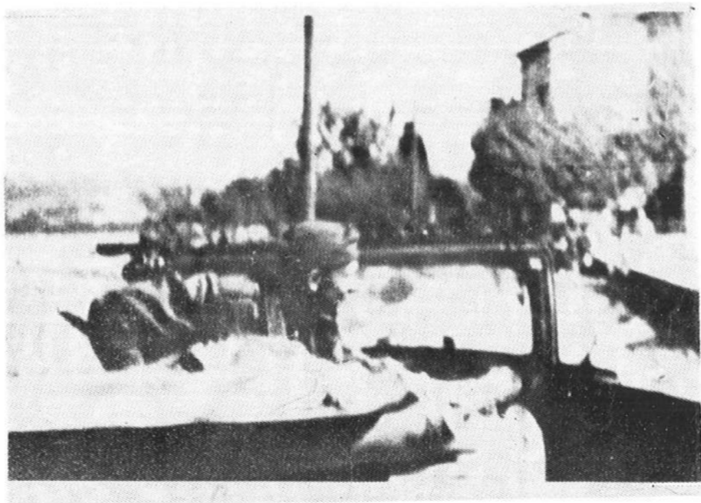
Borbe za oslobođenje Punta i Krka