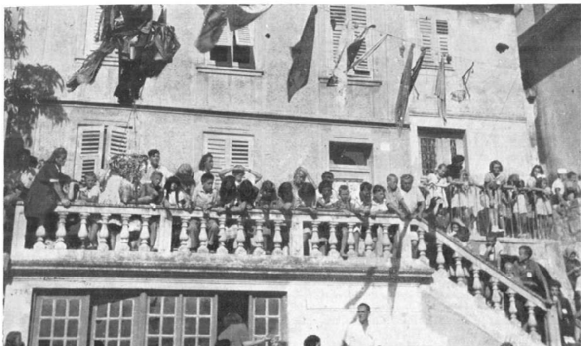
Stomorina u Omišlju pred 30-etak godina