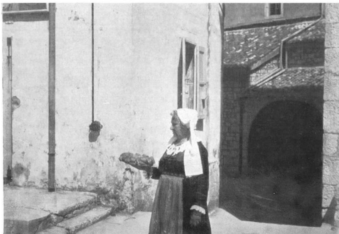
Kolač u »agventu«