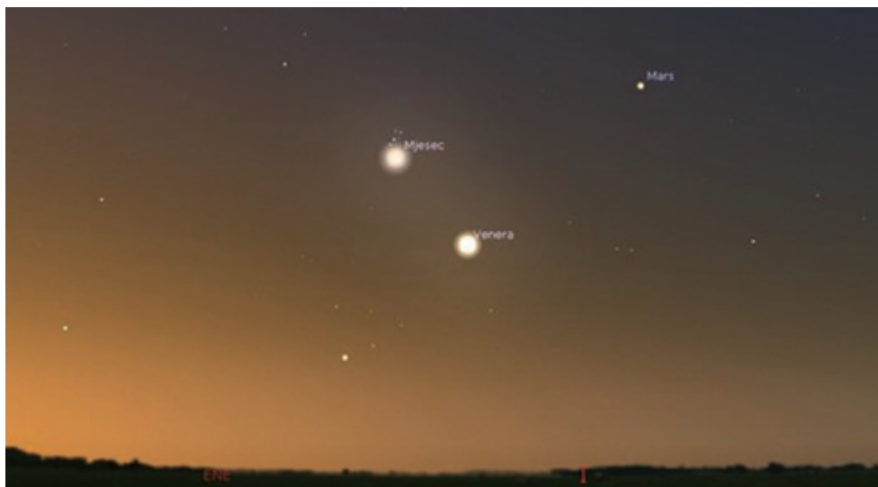
SLIKA 3. Konjunkcija Mjeseca, Marsa i Venere 17. lipnja 1582. 147