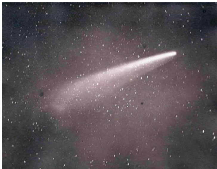
SLIKA 2. Komet iz Kreutzove grupe iz 1882. godine.