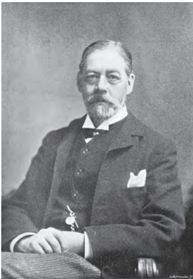
SLIKA 6. Thomas Graham Jackson