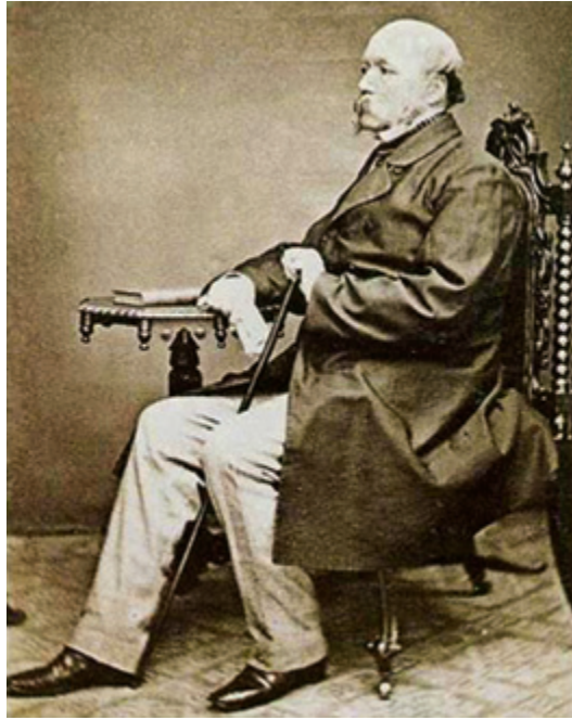
SLIKA 1. John Gardner Wilkinson