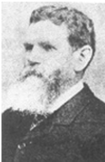
SLIKA 4. Andrew Archibald Paton