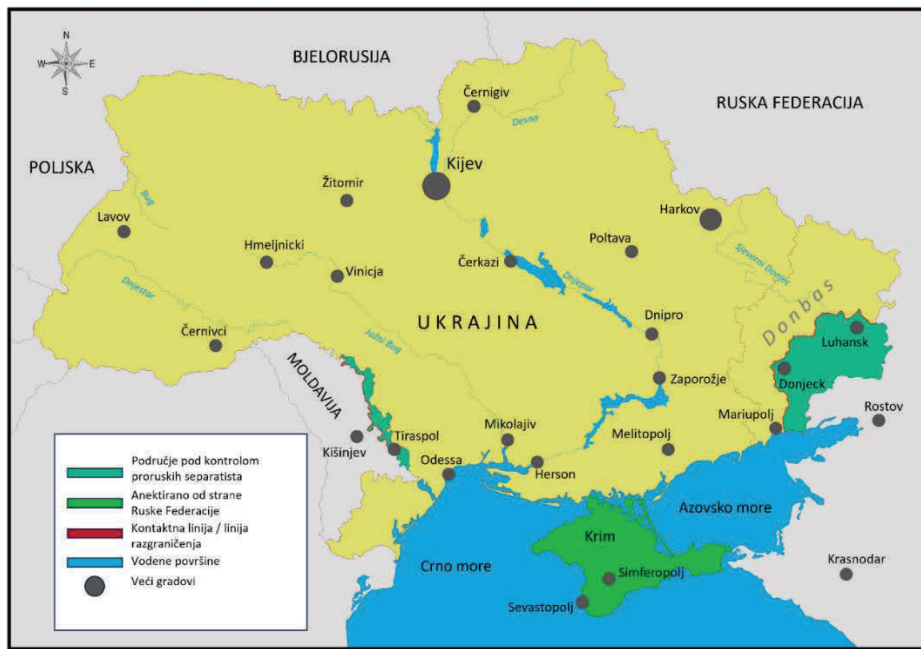
Slika 1. Ukrajina i regija do 2022. godine.