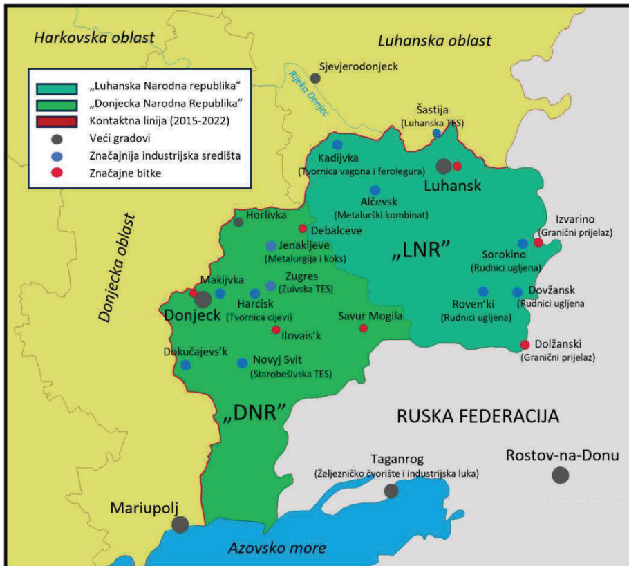
Slika 3. Područje Donbasa pod separatističkom kontrolom (do 2022. godine)