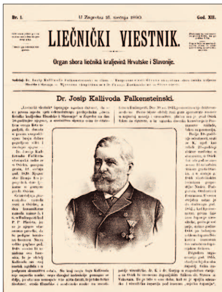
SLIKA 4. OBAVIJEST O SMRTI JOSIPA KALLIVODE-FALKENSTEINSKOG U LIEČNIČKOM VIESTNIKU BR. 2 IZ 1892. GODINE FIGURE 4. THE OBITUARY OF JOSIP KALLIVODA-FALKENSTEINSKI IN LIEČNIČKI VIESTNIK, N. 2 FROM 1892