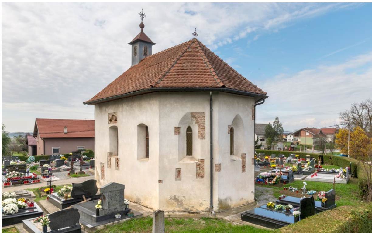
1. Pogled na jugoistočno pročelje kapele sv. Martina (arhiva HRZ-a, snimka: K. Gavrilica, 2022.) Southeast facade of the chapel of St Martin (HRZ Archive, K. Gavrilica, 2022)

iz kanonskih vizitacija i povijesnih dokumenata. 2 Josip Buturac piše o kapeli sv. Martina u knjizi Vrbovec i okolica , pregledu župnih crkava i kapela na području Vrbovca. 3 Stjepan Kožul predstavlja kapelu sv. Martina u knjizi Sakralna umjetnost bjelovarskog kraja . 4 Lokalitet Dubrava, sa župnom crkvom sv. Margarete i kapelom sv. Martina, navodi Vladimir Peter Goss u svojem Registru položaja i spomenika ranije srednjovjekovne umjetnosti u međuriječju Save i Drave . 5 Lelja Dobronić, Maja Cepetić i Milan Kruhek u svojim radovima pišu o Dubravi kao značajnom lokalitetu u kontekstu povijesnih istraživanja krajiških obrambenih utvrda te zemljišnih posjeda zagrebačkih biskupa i njihovih granica. 6