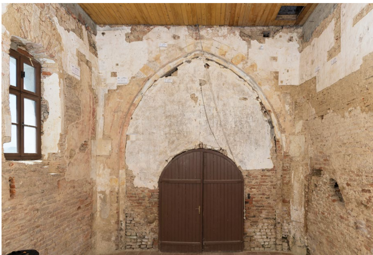
6. Pogled na zapadni zid kapele i zazidani trijumfalni luk (arhiva HRZ-a, snimka: K. Gavrilica, 2022.) West wall of the chapel and brick triumphal arch (HRZ Archive, K. Gavrilica, 2022)