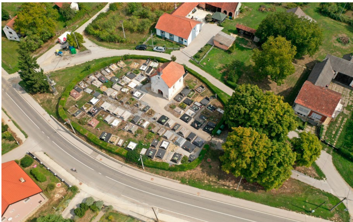
2. Pogled na današnju grobljansku kapelu sv. Martina iz zraka Present-day cemetery chapel of St Martin