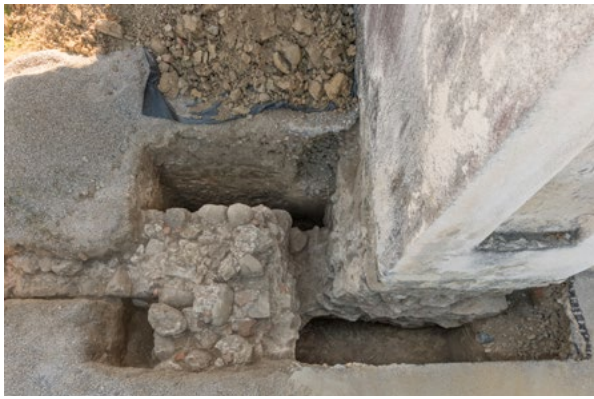
4. Arheološka sonda na sjeverozapadnom kutu kapele sv. Martina Archaeological probe at the northwest corner of the chapel of St Martin

Na fotografiji iz 1972. godine nad zapadnim prozorom na južnom pročelju nazire se zazidani gotički prozor šiljata nadvoja, 42 a vrh nadvoja ide do recentnog potkrovnog vijenca. Zorislav Horvat po tome zaključuje da je svetište prvotno bilo više za nekih 100 cm te da je naknadno sniženo, odnosno da prilikom obnove crkve početkom 17. stoljeća svetište više nije imalo križno-rebrasti svod, već je bilo natkriveno ravnim stropom. 43