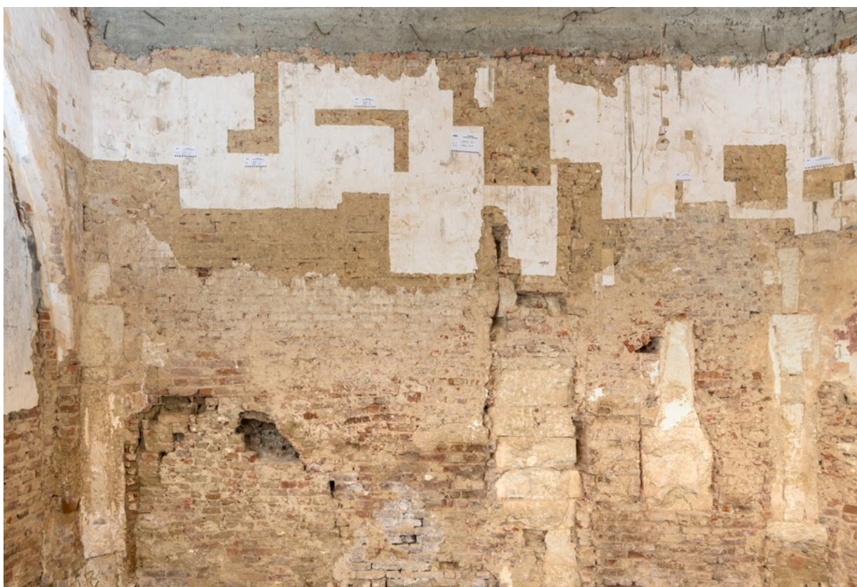
9. Pogled na sjeverni zid kapele sv. Martina (arhiva HRZ-a, snimka: K. Gavrilica, 2022.) North wall of the chapel of St Martin (HRZ Archive, K. Gavrilica, 2022)