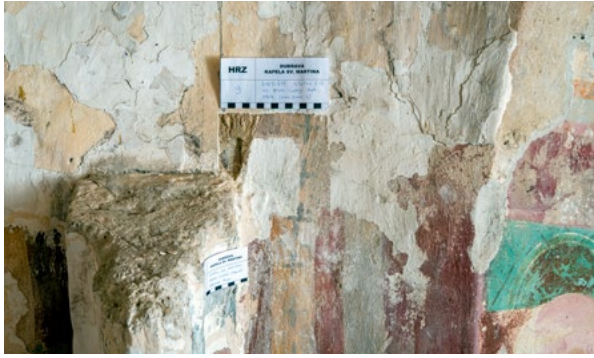
7. Sonda 9, istočni zid svetišta (arhiva HRZ-a, snimka: K. Gavrilica, 2022.) Probe 9, east wall of the sanctuary (HRZ Archive, K. Gavrilica, 2022)

formata nadvoja sedilije. Sve navedene arhitektonske promjene i popravci na zidovima izvedeni su opekom, vezanom smeđom „zemljanom“ žbukom, punom vidljivih bijelih granula vapna, te bijeljene, pokrivajući srednjovjekovni oslik. (sl. 7)