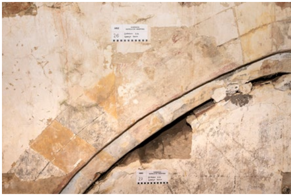
10. Sonda 26, gornja zona zapadnog zida kapele sv. Martina (arhiva HRZ-a, snimka: K. Gavrilica, 2022.) Probe 26, upper zone of the west wall of the chapel of St Martin (HRZ Archive, K. Gavrilica, 2022)

novijih slojeva žbuke, u čemu se odražavaju različite faze oblikovanja svetišta tijekom stoljeća, dok su mjestimično slojevi površinskih žbuka otpali do opečne građe.