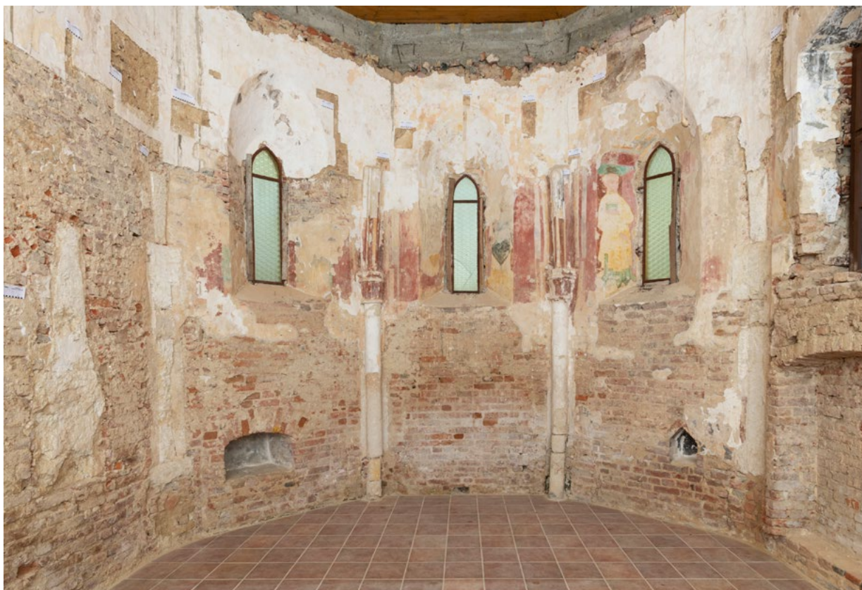
5. Pogled na trostrani završetak svetišta kapele sv. Martina Three-sided end of the sanctuary of the chapel of St Martin