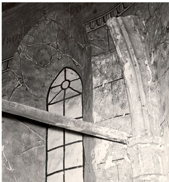
12. Detalj unutrašnjosti – gotički prozori s odbijenim rebrom (1954., inv.br.: 15137, neg.: I-H-103) Detail of the interior: Gothic windows with broken ribs (1954, inv. no.: 15137, neg.: I-H-103)

Svetački lik u jugoistočnom prozoru, odjeven u dalmatiku prebačenu preko dugačke haljine, prema ovim ikonografskim elementima odjeće vjerojatno predstavlja nekog svetog đakona, a zbog nedostatka drugih ikonografskih detalja ne možemo točno utvrditi o kojem se svecu radi. Đakon je prvi od viših svećeničkih redova, ustanovljen već u apostolsko doba, a prvi đakoni, koji se najčešće prikazuju u umjetnosti, bili su sv. Stjepan i sv. Lovro, 62 pa se možda radi o prikazu jednog od ove dvojice svetaca, štovanih već od početaka kršćanstva i predstavljenih na nekim od najranijih ostvarenja kršćanske umjetnosti. Prikazana knjiga u svećevoj lijevo ruci možda bi mogla upućivati da se radi o sv. Stjepanu, s obzirom na to da knjiga, kada označava Stari Zavjet, može biti njegov atribut. 63