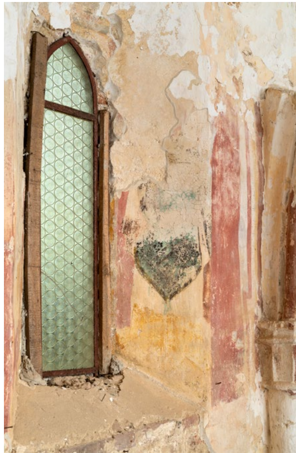
14. Pogled na južnu stranu prozorske niše istočnog zida svetišta South side of the window niche on the east wall of the sanctuary

Na području Prigorja srednjovjekovne zidne slike nalaze se u crkvi sv. Križa u Križevcima i župnoj crkvi sv. Brcka