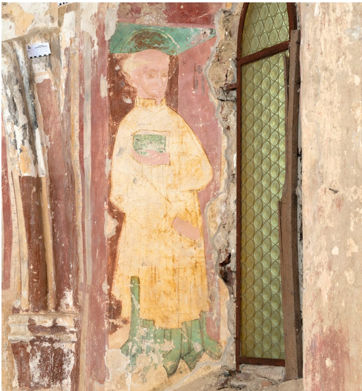
13. Pogled na sjevernu stranu prozorske niše jugoistočnog zida svetišta (arhiva HRZ-a, snimka: K. Gavrilica, 2022.) North side of the window niche on the southeast wall of the sanctuary (HRZ Archive, K. Gavrilica, 2022)

jugoistočni i južni zid svetišta loborske kapele podijeljeni su u polja u kojima su slikani pojedinačni svetački likovi. 65