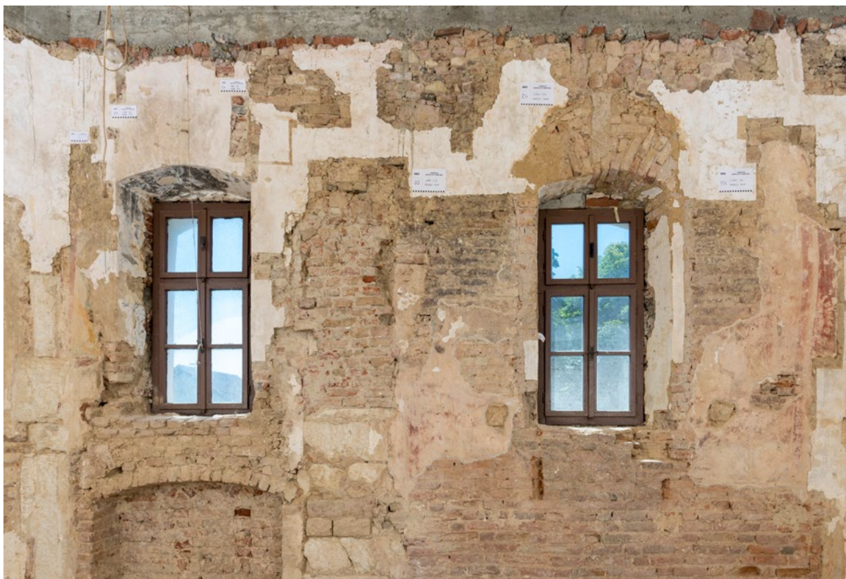
8. Pogled na južni zid kapele sv. Martina (arhiva HRZ-a, snimka: K. Gavrilica, 2022.) South wall of the chapel of St Martin (HRZ Archive, K. Gavrilica, 2022)