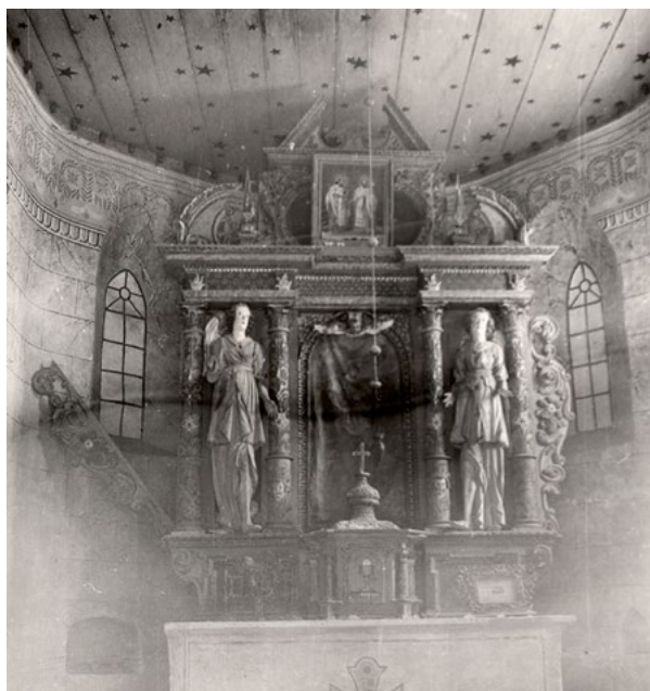
11. Pogled na oslik 20. st. i oltar iz 17. st. (1954., inv.br.:15311, neg.: II-2741) Painted layers from the 20 th century, and altar from the 17 th (1954, inv. no.: 15311, neg.: II-2741)