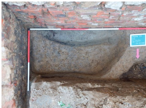
10. Otpadna jama ispod temelja sjevernog zida lađe i istočnog zida sjeverne sakristije Waste pit under the foundations of the northern wall of the nave and the eastern wall of the northern sacristy

s puno primjesa gara, mrvljene opeke i veziva, zatim životinjskim kostima te ulomcima keramičkih posuda i keramičkim grijačima. Prema nalazima pretpostavlja se da je riječ o otpadnoj jami. 33 U jami su nađeni ulomci isključivo kuhinjske keramike namijenjene svakodnevnoj upotrebi. Riječ je o ulomcima lonaca izrađenima na brzom lončarskom kolu, od kojih su neki ukrašeni urezanim vodoravnim ili valovitim linijama, odnosno otiskivanjem kotačića. (sl. 11) Većina oboda lonaca pripada istom tipu koji se javlja krajem 12. ili početkom 13. stoljeća te se zadržava u upotrebi sve do 16. stoljeća. 34 Prema karakteristikama oblikovanja i ukrašavanja, lonci pronađeni u otpadnoj jami najbliži su materijalu kakav se u kontinentalnom dijelu Hrvatske javlja tijekom 14. stoljeća, odnosno najkasnije u ranom 15. stoljeću. 35