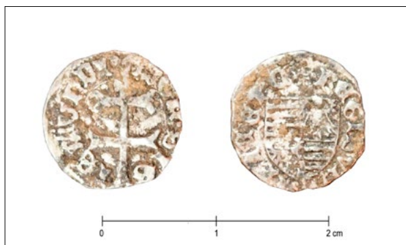
13. Srebrni novac iz groba 29 (arhiva HRZ-a, snimka: M. Krmpotić, 2023.) Silver coin from grave 29 (HRZ Archive, M. Krmpotić, 2023)

skoj se parte javljaju u grobovima od 14. do 18. stoljeća. 50 Najveći broj parti do sada je nađen na groblju uz župnu crkvu sv. Martina u Virju kod Koprivnice, gdje se javljaju već u najstarijem horizontu grobova iz 14. – 15. stoljeća, a najbrojnije su zastupljene u posljednjem horizontu datiranom u drugu polovicu 17. i rano 18. stoljeće. 51 Ostatci parti u grobovima kod crkve sv. Julijane gotovo su u potpunosti propali, izuzev primjerka iz groba 13, izrađenog od prepletenih brončanih žica s privjescima od brončanog lima i sitnim staklenim perlama. (sl. 12)