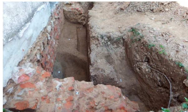
8. Ostaci temelja sjeverne sakristije, pogled s istoka Remains of the northern sacristy's foundations, view from the east