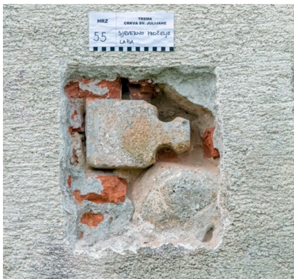
3. Kamena spolija gotičkog rebra uzidana u sjeverno pročelje lađe crkve sv. Julijane Stone spolia of the Gothic rib built into the north façade of the nave of the church of St. Juliana

materijali korišteni za podizanje novih objekata nakon uspostave mira.