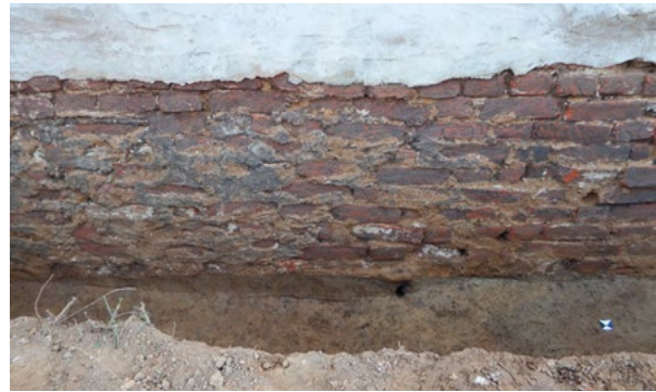
6. Pogled na temelje sjevernog zida lađe (arhiva HRZ-a, snimka: J. Maslač, Solis arheo, 2023.) View of the foundations of the northern wall of the nave (HRZ Archive, J. Maslač, Solis arheo, 2023)