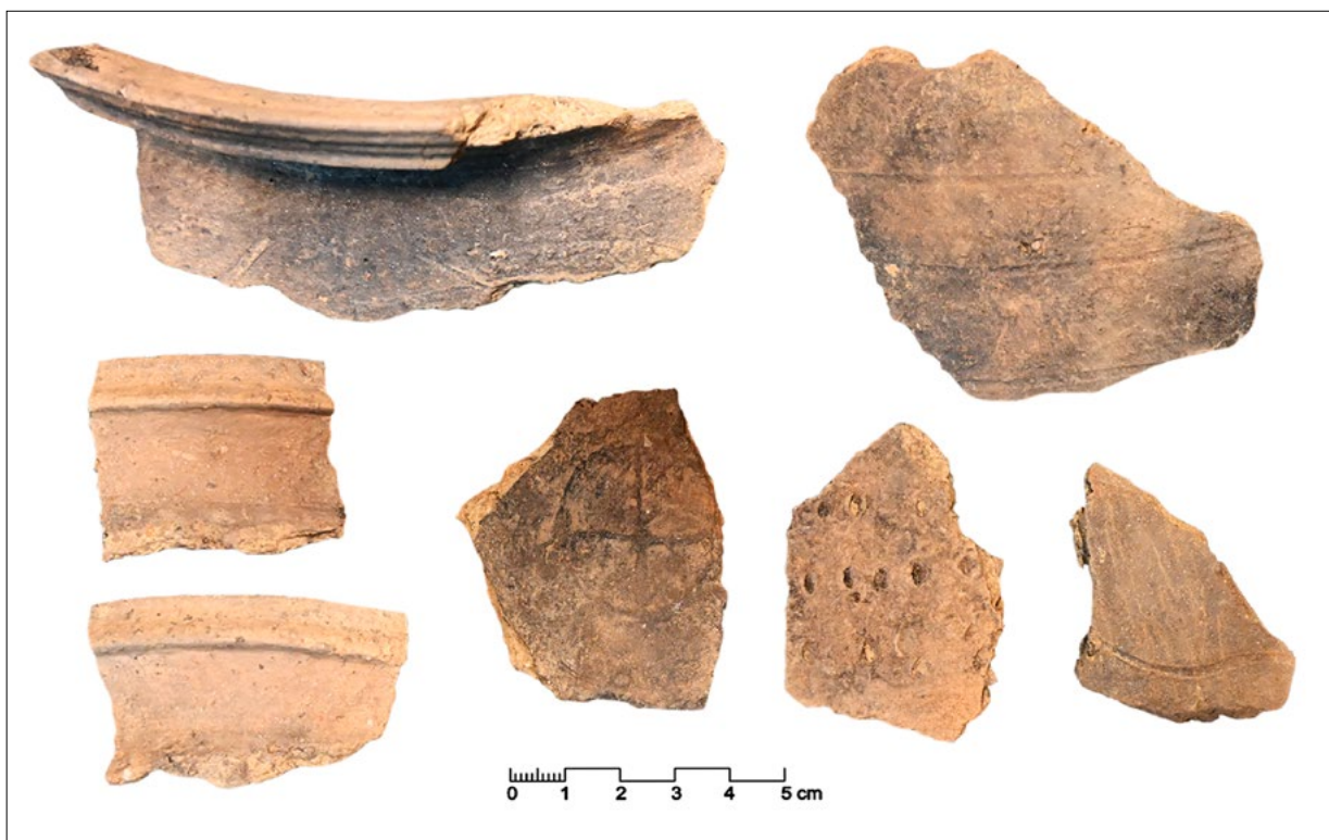
11. Ulomci keramičkih lonaca iz otpadne jame Fragments of pottery from the waste pit

Grobovi su većinom pravilno orijentirani u smjeru zapad – istok, što je uobičajena praksa u srednjovjekovnom razdoblju, ili s blagim odklonom u smjeru zapad-sjeverozapad – istok-jugoistok. Ovu praksu ne primjenjuje nekoliko grobova. Jedan dječji grob uz tjeme apside, inače i znatno pliće ukopan od svih ostalih istraženih grobova, orijentiran je u pravcu jug – sjever (grob 1), a dva dječja groba uz zapadni zid crkve smjera su sjever – jug (grobovi 15 i 17). Izdvaja se i manja skupina grobova smještenih uz sjeverozapadni ugao crkve u kojima su pokojnici orijentirani glavom prema jugozapadu (grobovi 9, 10, 11 i 12). U istom su smjeru orijentirana i dva groba sa sjeverne strane apside (grobovi 2 i 6), kao i dječji grob 44 s njene južne strane. Orijentacije različite od uobičajene u srednjem su vijeku mogle biti rezultat nastojanja sahrane što bliže zidovima crkve, odnosno prilagođavanja dostupnom prostoru.