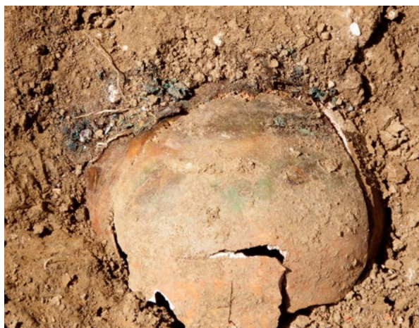
12. Ostatci parte in situ u grobu 13 Remains of a maiden's garland in situ in grave 13

Parte ili tzv. djevičanski vijenci su trake od izvezene ili na neki drugi način ukrašene tkanine koju nose djevojke kao dio svečane opreme. Djevojke koje bi preminule prije udaje, ponekad bi bile sahranjene s partom. U arheološkom kontekstu parte nalazimo u grobovima ženske djece, djevojaka i mladih žena. 47 Relativno su česte u Mađarskoj, gdje se smatraju dijelom nošnje viših i srednjih društvenih slojeva, najčešće od 16. do 18. stoljeća. 48 Na mađarskom se prostoru parte javljaju u različitim varijantama, ukrašene perlicama, metalnim pločicama, uvijenim metalnim nitima, a ponekad i dragim kamenjem. Tijekom 14. i 15. stoljeća parte su ukrašavane jednostavnim polukuglastim aplikama, rozetama, odnosno tiještenim pločicama, a javljaju se i na proboj rađene aplikke, kakve su prisutne još i u 16. stoljeću. Od 16. stoljeća parte su ukrašavane metalnom žicom i perlama, da bi u 17. i 18. stoljeću bile bogato dekorirane metalnim nitima, zlatnim pločicama i perlama. Postaju dio karakteristične narodne nošnje i nose se sve do početka 19. stoljeća. 49 U Hrvat-