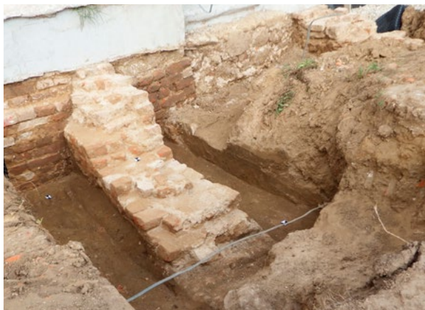
9. Ostaci temelja južne sakristije, pogled s jugozapada Remains of the southern sacristy's foundations, view from the southwest