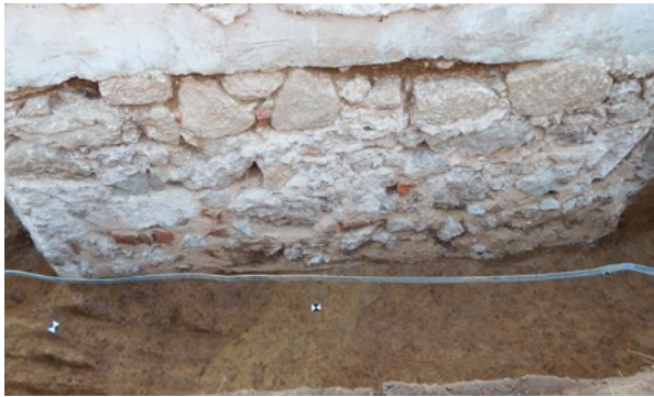
5. Pogled na temelje sjeveroistočnog zida apside (arhiva HRZ-a, snimka: J. Maslač, Solis arheo, 2023.) View of the foundations of the north-eastern wall of the apse (HRZ Archive, J. Maslač, Solis arheo, 2023)