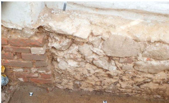
7. Spoj temelja južnog zida lađe i apside Seam between the foundations of the southern wall of the nave and the apse