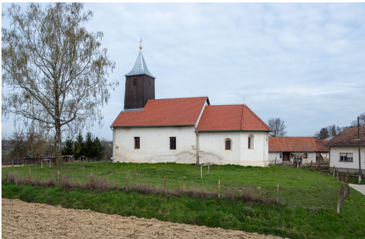
1. Pogled s juga na crkvu sv. Julijane u Tremi (arhiva HRZ-a, snimio: J. Kliska, 2021.) Church of St. Juliana in Trema, view from the south (HRZ Archive, J. Kliska, 2021)

Kalničkog arhidakonata, umjesto ranijih 40, 1574. godine navedeno ih samo 19, od kojih je 7 bilo ispražnjeno. 15 Do polaganog oporavka i obnove župa dolazi tek nakon potpisivanja prvog mirovnog sporazuma između Habsburške monarhije i Osmanlija 1606. godine. Tijekom 17. stoljeća na prostoru Kalničkog arhidakonata polako se, obnavljanjem starih župa, ponovno uspostavlja crkvena organizacija. U popisima župa, navedeno je da je 4. kolovoza 1653. godine za župnika sv. Julijane u Tremi prisegao Mihael Ivančan, što je najraniji izričiti spomen tremske župe, 16 dok se župna crkva sv. Julijane prvi put spominje 1667. godine. 17 Još snažniji poticaj naseljavanju stanovništva, a time i osnivanju župa na području istočno od Križevaca, uslijedio je nakon mira u Srijemskim Karlovcima 1699. godine, kada dolazi i do osnivanja novih župa te obnove starih i izgradnje novih crkava.