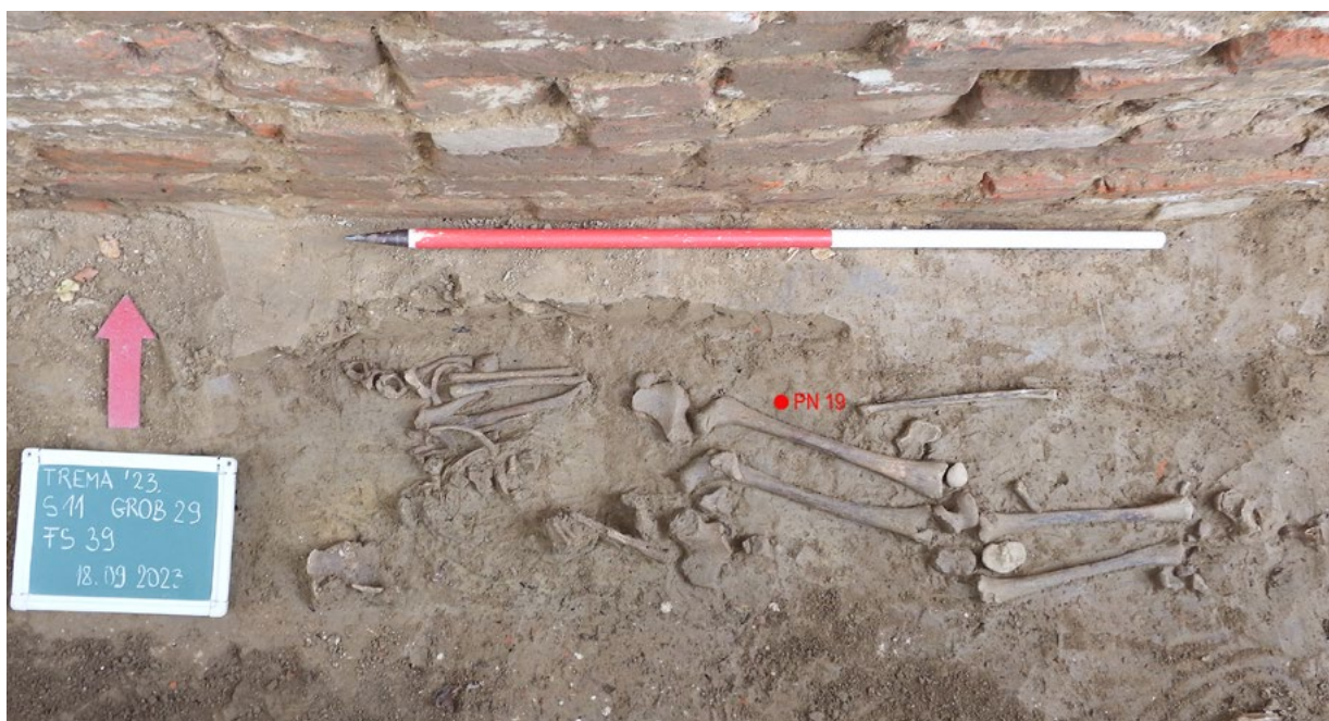
14. Grob 29 s označenim položajem novca u grobu (arhiva HRZ-a, snimka: M. Babeli, 2023.) Grave 29 with position of coins (HRZ Archive, M. Babeli, 2023)

Rezultatima provedenih analiza istraženi dio groblja datiran je od kraja 13. ili početka 14. do u 16. stoljeće. Na temelju datuma dobivenog za uzorak kosti iz groba 10, može se pretpostaviti da su najstariji grobovi ukopani krajem 13. ili u ranom 14. stoljeću uz sjeverozapadni ugao crkve. Ovi grobovi u orijentaciji pokazuju značajan odmak u smjeru jugozapad – sjeveroistok i presječeni su temeljima sjevernog zida lađe. Nešto je mlađi grob 32, datiran u 14. stoljeće. Smješten je pred zapadnim pročeljem, pravilno je orijentiran te presječen zapadnim zidom lađe crkve. U sam kraj 14. ili u rano 15. stoljeće datirani su grobovi 3 i 9, oba s blagim otklonom prema jugozapadu. Grob 3 presječen je temeljima sjeveroistočnog zida apside, dok grob 9 leži uz zapadni dio sjevernog zida lađe, no nije u potpunosti paralelan s njim. Grobovi 5 i 29, datirani u 15. stoljeće, pravilne su orijentacije i paralelni sa zidovima lađe. Grob 5, koji leži sa sjeverne strane lađe, oštećen je pri podizanju temelja sjeverne sakristije, dok se grob 29 nalazi uz južni zid lađe, a kosti su mu poremećene. Najmlađi od datiranih grobova, grob 15, orijentiran je u smjeru sjever – jug i ukopan uz pročelje, paralelno sa zapadnim zidom crkve te je vjerojatno u vrijeme njegova ukopa lađa crkve već postojala.