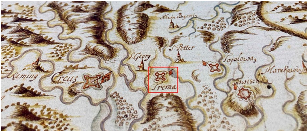
2. Prikaz područja istočno od Križevaca na karti M. Stiera (ÖNB Cod.8608, fol. 74, prema Krmpotić 1997, 89) View of the area east of Križevci on M. Stier's map (ÖNB Cod.8608, fol. 74, from: Krmpotić 1997, 89)

se oprema dvama novim bočnim oltarima s kipovima koji su atribuirani varaždinskom kiparu Ivanu Adamu Rosembergeru, 21 a 1762. godine nabavlja se i novi glavni oltar. 22 Nešto ranije, sjeverna sakristija je porušena i podignuta je nova, uz južnu stranu svetišta. 23