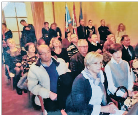
S PROSLAVE 70. GODIŠNJICE HLZ-A PODRUŽNICE ŠIBENIK UZ PROMOCIJU KNJIGE PRIČA O NAMA, 2016.