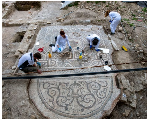
12. Solin (Salona), konzervatorsko-restauratorski radovi na antičkom mozaiku