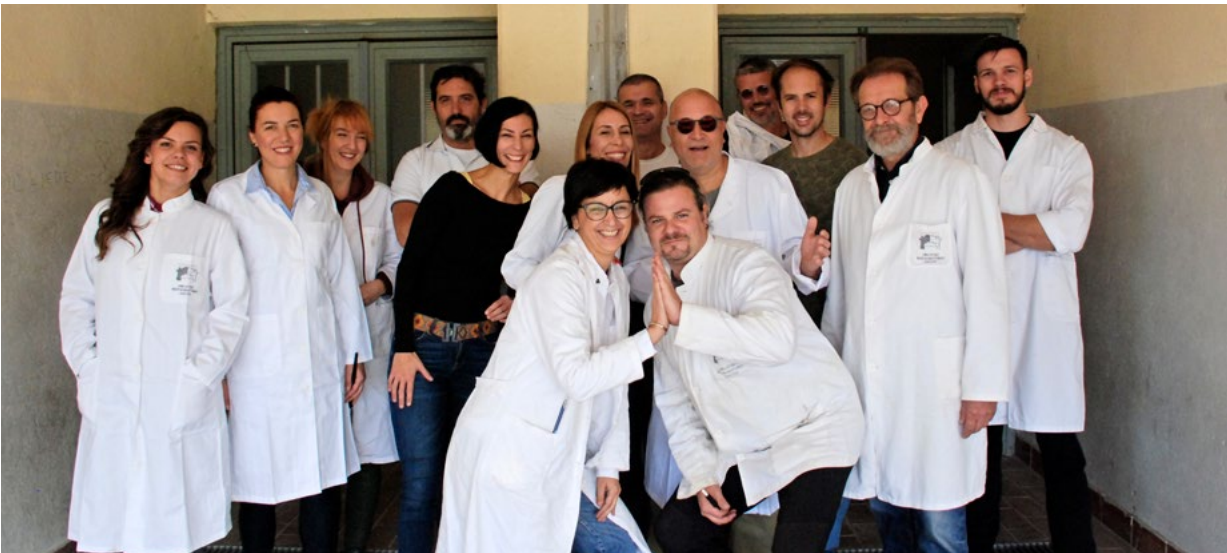
7. Djelatnici Odjela za kamenu plastiku, zidne slike i mozaik