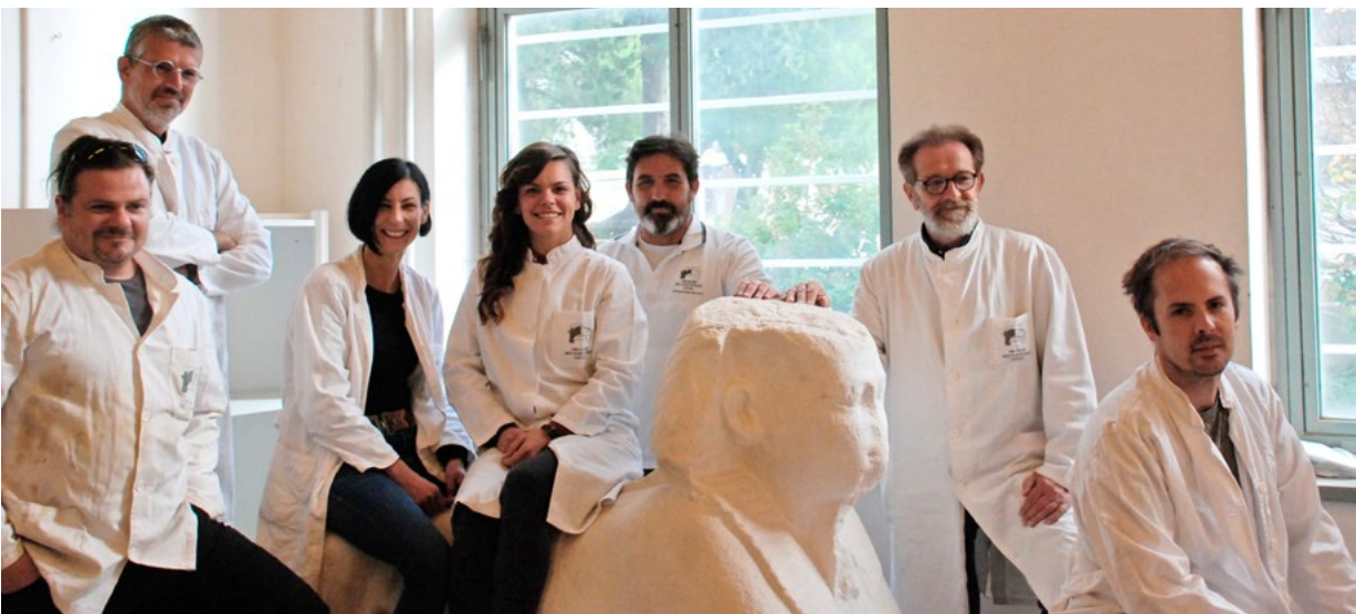
8. Djelatnici Odsjeka za kamenu plastiku (arhiva HRZ-a, 2019.)