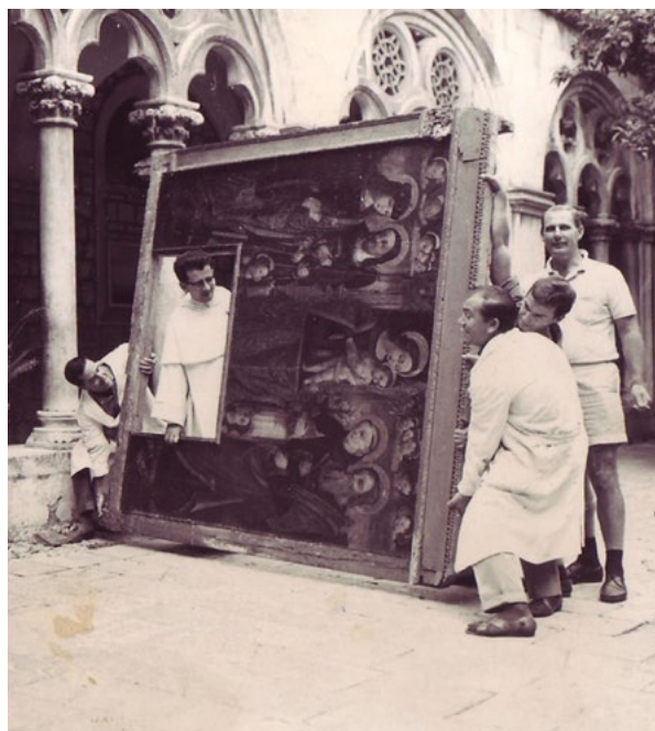
2. Slika „Sveta konverzacija“ Nikole Božidarevića iz Dominikanskog samostana u Dubrovniku (snimka: D. Domančić, 1966.)