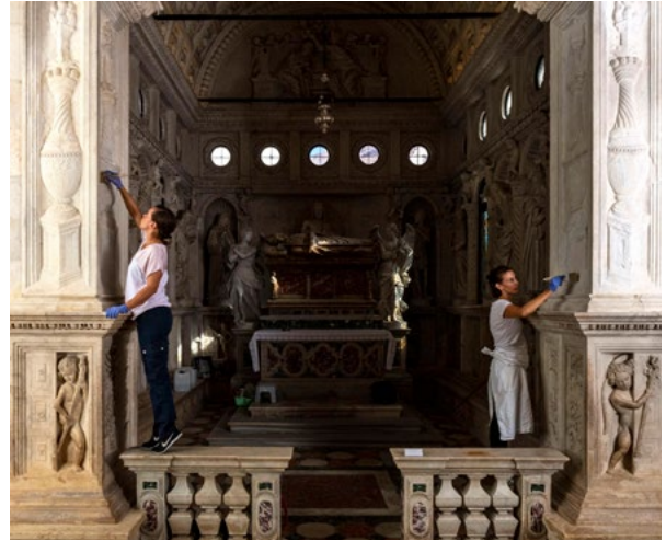
10. Trogir, katedrala sv. Lovre, konsolidacijski radovi na kamenoj plastici u kapeli Orsini