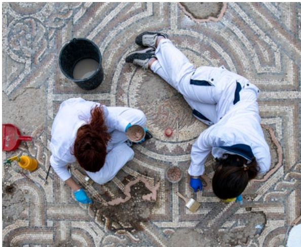
11. Solin (Salona), konsolidacija antičkog mozaika