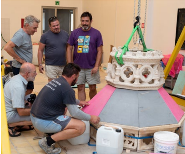
9. Radionica Odsjeka za kamenu plastiku na Dračevcu, Split. Proba montaže ciborija iz katedrale sv. Marka u Korčuli