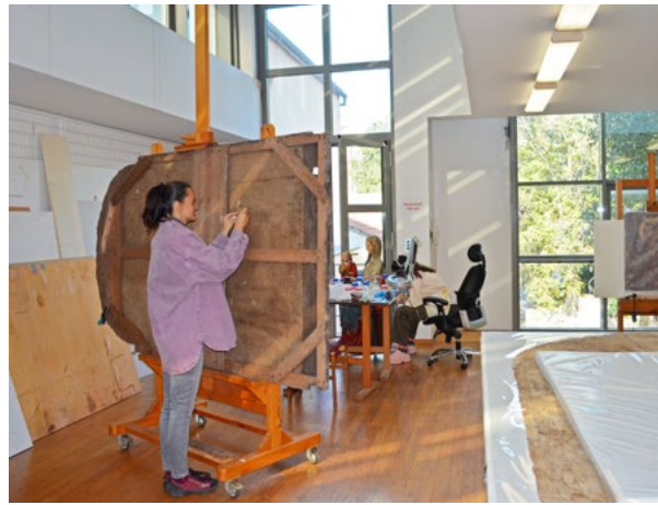
6. Konzervatorsko-restauratorski radovi na slici „Bogorodica s Djetetom i sv. Nikolom“ 17. stoljeće iz crkve sv. Petra u Trogiru, Jelena Zagora