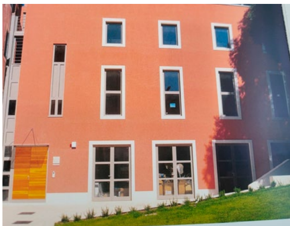
3. Zgrada Restauratorskog odjela Split Hrvatskog restauratorskog zavoda