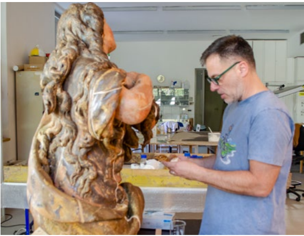
5. Konzervatorsko-restauratorski radovi na skulpturi „sv. Marije Magdalene“ 17. stoljeće, s oltara Sv. Križa iz crkve sv. Marka u Makarskoj, Bernard Štević (snimka: B. Carev, 2024.)