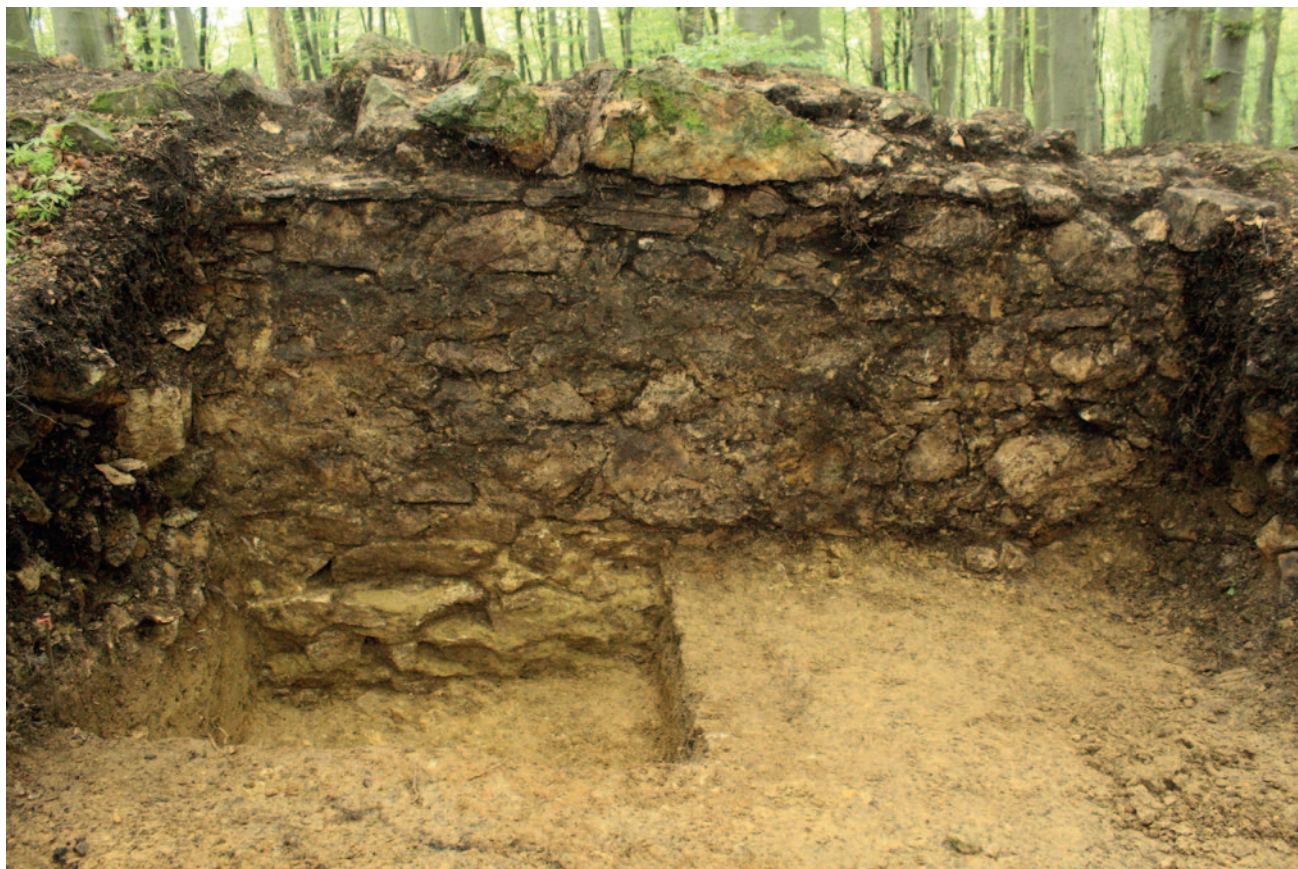
Sl. 3 Zid u sondi 23

U sloju prhke svjetlije žute zemlje pronađeni su ulomci prapovijesne keramike, za koje zbog fragmentarnosti i oštećenosti materijala, nije bilo moguće odrediti kojem točno prapovijesnom razdoblju pripadaju. Iznimka je ulomak posude pronađene u rovu 1 koji pripada starijoj fazi kulture polja sa žarama (sl. 4). Slični su keramički oblici pronađeni na lokalitetu Blizna kod Jakopovca kraj Varaždina (Bekić 2006: 109–110) udaljenom tek 15-ak km od utvrde Gradišće. Postoji mogućnost da je ovaj sloj zapravo izbačen tijekom kopanja temelja te vremenom ispran, no tu bi pretpostavku tek trebalo ispitati (Belaj 2008: 27). U urušnju zida, osim ulomaka prapovijesne keramike, u sondi 23 pronađeni su i ulomci minimalno jednog, a vjerojatnije dva kasnosrednjovjekovna lonca koji se na osnovi profilacije ruba, fature i ukrasa mogu datirati u široko razdoblje od sredine 13. do u 15. stoljeće (sl. 5). Raspoloživa keramička građa ne daje dovoljno podataka za rekonstrukciju oblika posuda. Ulomci su ukrašeni kombinacijom jednostruke valovnice i vodoravne linije. Na nekim se ulomcima ramena lonca valovnica pojavljuje visoko ispod vrata i iznad vodoravne linije ili se nalazi između vodoravnih linija, a na nekima prelazi preko vodoravne linije. Ulomci trbuha s nizovima isključivo vodoravnih linija pripadaju istoj posudi koja je na ramenu bila ukrašena kombinacijom valovnica i vodoravnih linija. Slično