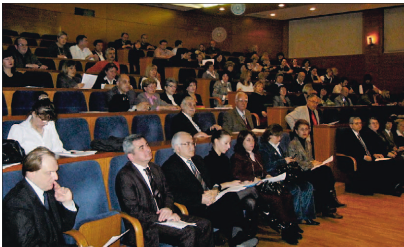
SL. 2. ZAJEDNIČKI ZNANSTVENI SASTANAK (JOINT SCIENTIFIC MEETING) HED-A I ECDC-A U DVORANI HRVATSKOGA LIJEČNIČKOG ZBORA U ZAGREBU 2008. GODINE