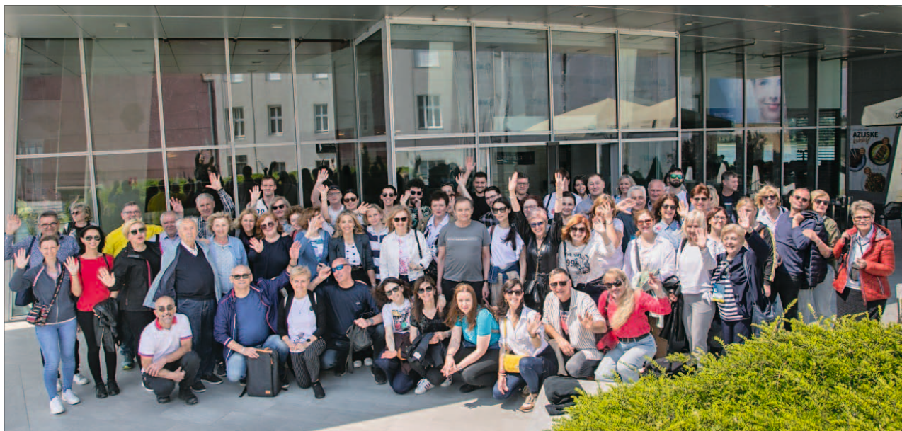
SL. 4. SUDIONICI 5. HRVATSKOGA EPIDEMIOLOŠKOG KONGRESA S MEĐUNARODNIM SUDJELOVANJEM U OSIJEKU 2023. GODINE

rastu u tradiciju kroz održavanje svake dvije godine na istom mjestu, u Supetru na otoku Braču zbog prepoznatljivosti.