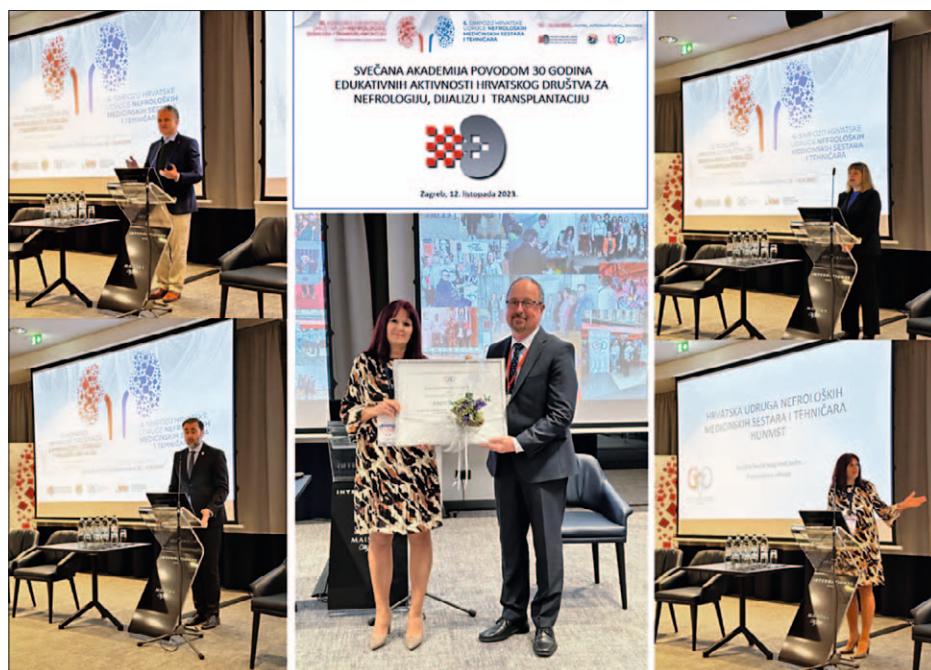
SLIKA 7. OBILJEŽAVANJE 30 GODINA RADA HDNDT-A TIJEKOM JUBILARNOG 10. KONGRESA ODRŽANOG U ZAGREBU 2023. GODINE