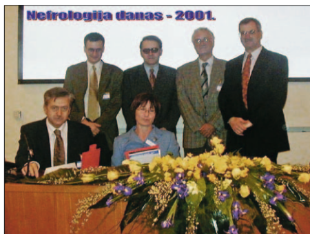
SLIKA 3. NEFROLOGIJA DANAS – TRADICIONALNI SIMPOZIJ HDNDT-A U RAZDOBLJU OD 1998. DO 2013. GODINE