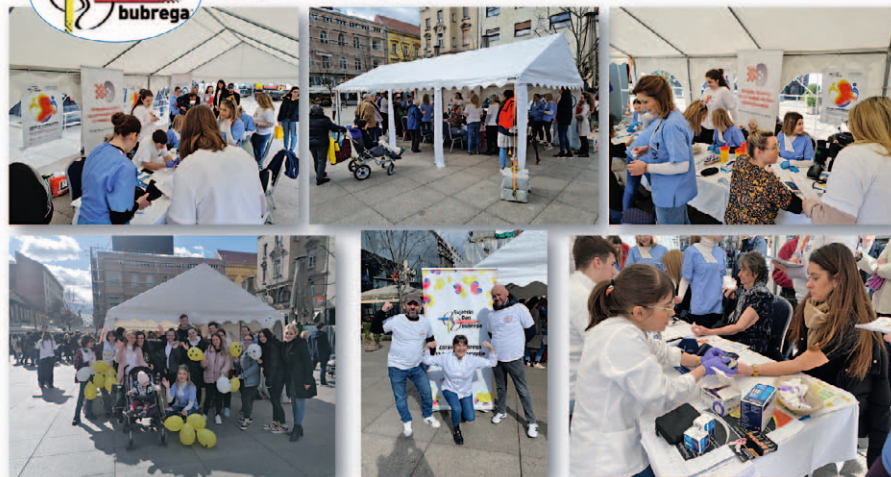
SLIKA 6. SVJETSKI DAN BUBREGA – JAVNOZDRAVSTVENE AKTIVNOSTI DRUŠTVA