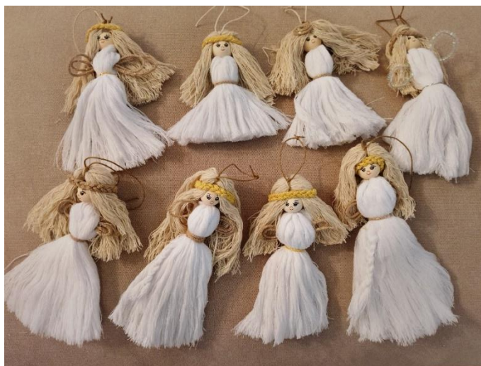
Slika 6. Lutkice koje su izradili učenici na satu razrednika

Svi učenici vole nešto kreativno izrađivati rukama. Uz pomoć vune i drvenih kuglica učenici su izrađivali lutkice i anđele. Svaki učenik izradio je jednu lutkicu koju je mogao zadržati za sebe ili pokloniti nekoj dragoj osobi, mami, sestri, baki, prijateljici i slično (slika 6).