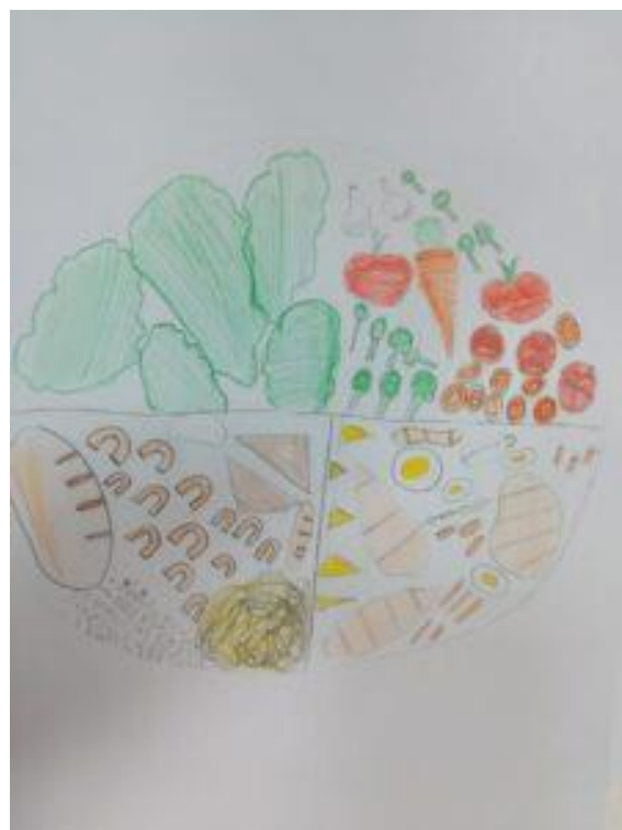
a) b) Slika 10. a) i b) Prikaz rada učenika: zdrav tanjur

Ovisnost je veliki problem mladih i odraslih. Ovisnost nije nešto što se događa tek u srednjoj školi, ona se događa sada i svagdje i u ranoj dječjoj dobi. Mjesec borbe protiv ovisnosti svake se godine obilježava u razdoblju od 15. studenog do 15. prosinca. Cilj obilježavanja borbe protiv ovisnosti je upozoriti javnost na probleme ovisnosti kod svih uzrasta djece i mladih. Povodom obilježavanja Mjeseca borbe protiv ovisnosti, Povjerenstvo za suzbijanje zlouporabe opojnih droga i ovisnosti Vukovarsko-srijemske županije organiziralo je likovni natječaj za učenike osnovnih škola na temu preventivnih poruka, te su izabrani najbolji uradci koji su izloženi u Gradskoj knjižnici i čitaonici Vinkovci. Tijekom sata razrednika učenici su svoje poruke prenijeli na papir. Jedan rad po razredu šalje se na natječaj. Unutar razreda izabran je jedan rad i poslan. Na ponos cijelog razreda baš taj rad naše učenice izabran je kao najbolji i nagrađen. Sam rad šalje jasnu poruku (slika 11).