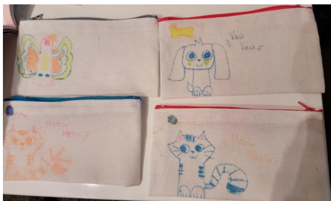
Slika 8. Oslikane pernice s motivom životinje

Moto oslikavanja platnenih vrećica bio je : „Jedna vrećica u moru, dupinu čini noćnu moru!“. Osim platnenih torbi učenici su oslikavali i platnene pernice (slika br. 8 a) koje su izrađene od recikliranog materijala.