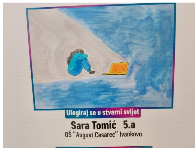
Slika 11. Nagrađeni rad učenice