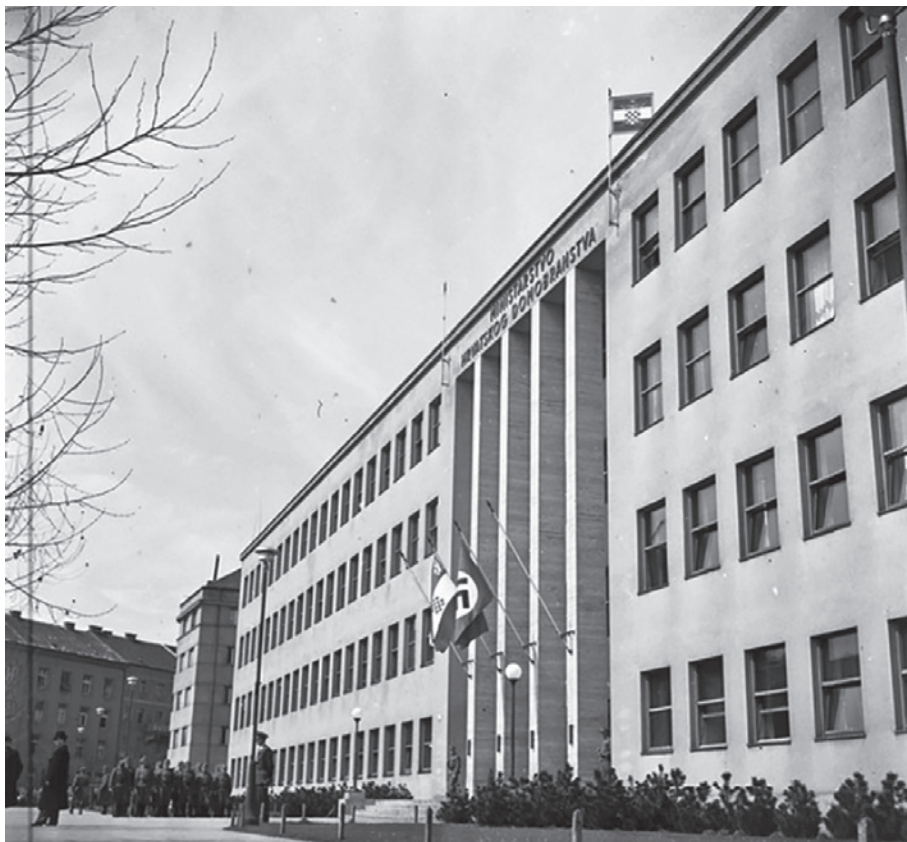
Slika 3. Zgrada Ministarstva hrvatskoga domobranstva, prvotnoga sjedišta Ratnoga arhiva i muzeja NDH (fotografija pročelja zgrade snimljena prilikom primanja Siegfrieda Kaschea 9. travnja 1942., inv. br. predmeta HPM-98680)