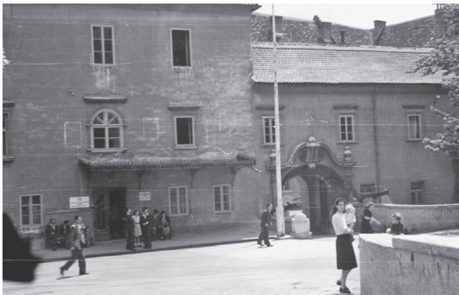
Slika 5. Pogled na nekadašnju zgradu Ratnoga arhiva i muzeja NDH na Jezuitskom trgu 1945. godine (dokumentacija Galerije Klovićevi dvori, fotografija pročelja 1945. godine)