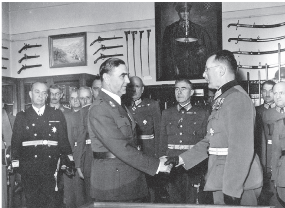
Slika 4. Ante Pavelić i upravitelj Ratnoga arhiva i muzeja Milan pl. Praunsperger na svečanom otvorenju prostorija Ratnoga arhiva i muzeja na Jezuitskom trgu