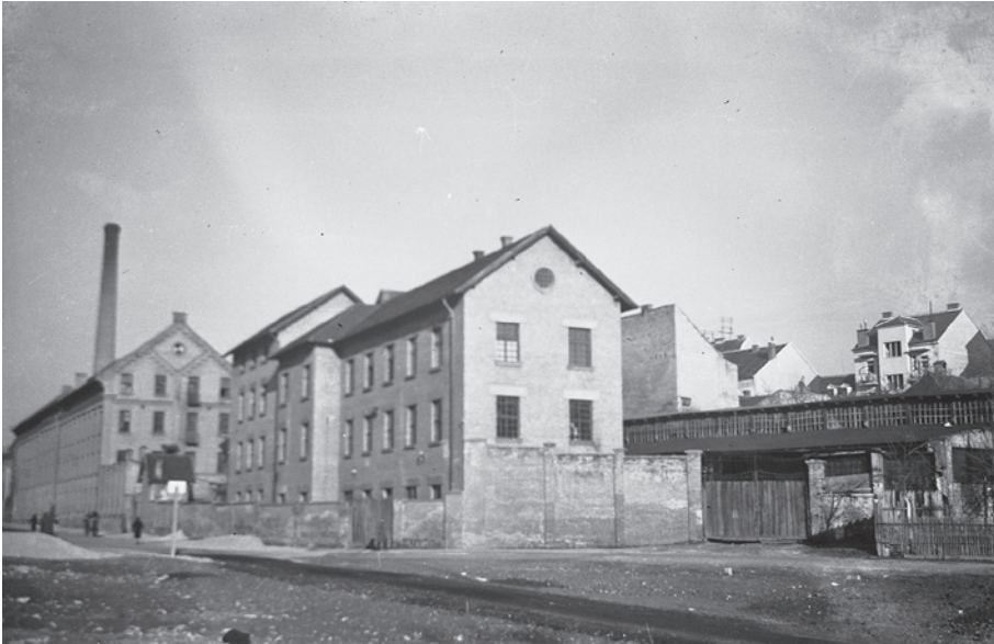
Slika 6. Pogled 1940. godine na tvorničke zgrade u kojima se nalazi Gipsoteka, a koje je za vanjske čuvaonice tijekom Drugoga svjetskog rata koristio i Ratni arhiv i muzej NDH (fototeka Gliptoteke HAZU, inv. br. F-37)