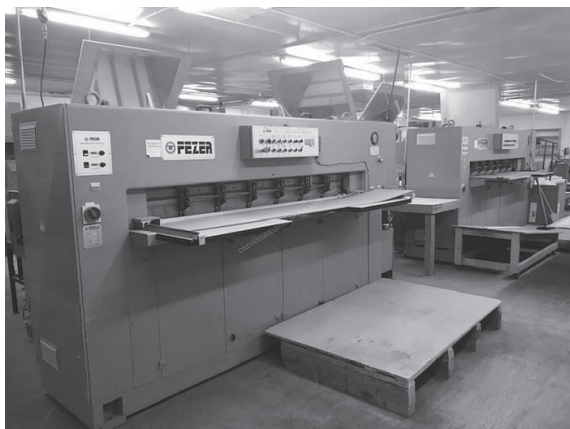
Slika 1. Škare za furnir