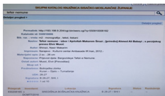
Primjer 3. Shirazi, N. M.: Tefsir Nemune

Example 2. Juma, E.: Twenty Principles of understanding Islam