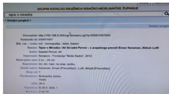
Primjer 4. Saadet Perver, A.: Tajne s Miradza

Example 3. Shirazi, N. M.: Tefsir Nemune