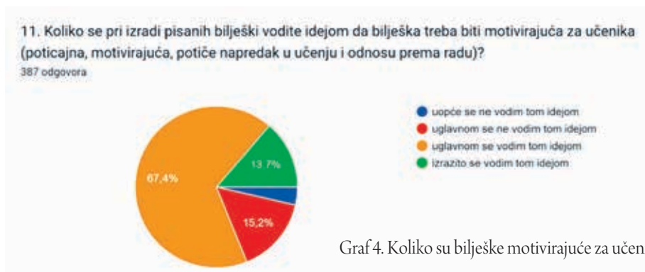
Graf 4. Koliko su bilješke motivirajuće za učenike

Kada je u pitanju motivacija, na Grafu 4. vidimo procjene nastavnika u kojoj se mjeri, prilikom izrade pisanih bilježaka o učenicima, vode idejom da budu motivirajuće za daljnje učenje. Više od 80 % nastavnika izjavljuje kako se uglavnom ili u potpunosti vodi tom idejom. U Tablici 2. prikazani su rezultati u kojima se nastavnici pri pisanju bilježaka o učenicima uglavnom vode idejom da ista treba biti motivirajuća za učenika ( M=2,91 , sd=0,654 ), ali više idejom da treba služiti za informaciju roditeljima ( M=3,15 , sd=0,612 ), a njihove bilješke su uglavnom usmjerene na uspjeh, postignuće i napredovanje te pozitivna ponašanja ( M=2,98 , sd=0,529 ).