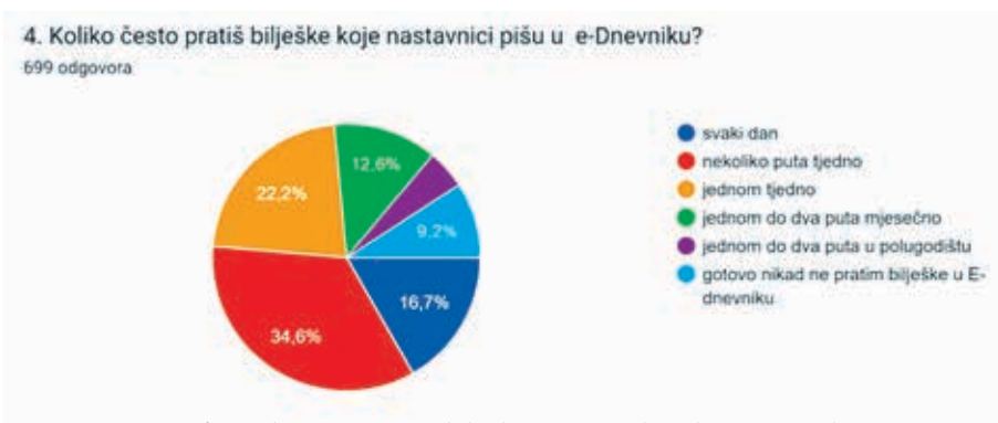
Graf 2. Redovitost praćenja bilješki u e-Dnevniku od strane učenika

Rezultati ispitivanja o kompetencijama nastavnika, značaju te redovitosti vođenja i praćenja bilježaka. Na Grafovima 2. i 3. vide se rezultati redovitosti praćenja bilježaka u e-Dnevniku od strane učenika i roditelja.