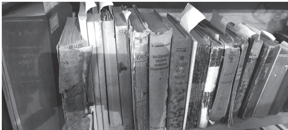
Slika 1. Izdanja knjiga fra Andrije Kačića Miošića, Knjižnica samostana u Zaostrugu