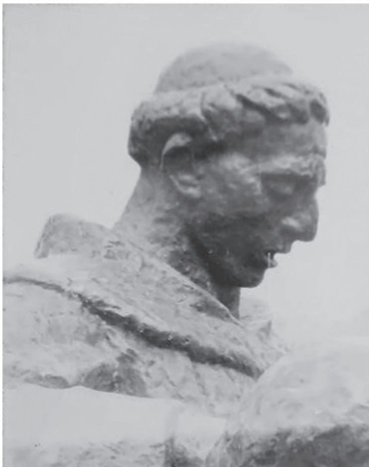
Slika 4. Fotografija Meštrovićeva spomenika fra Andrije Kačića Miošića u Bristu