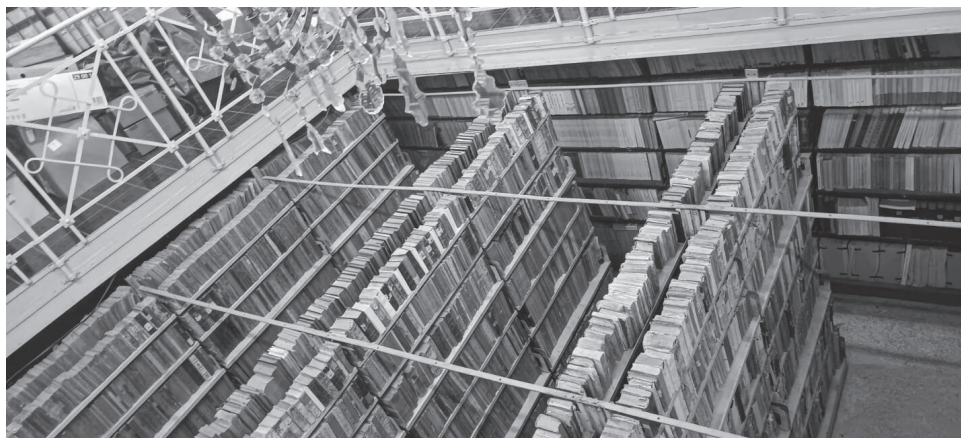
Slika 2. Knjižnica samostana u Zaostrugu