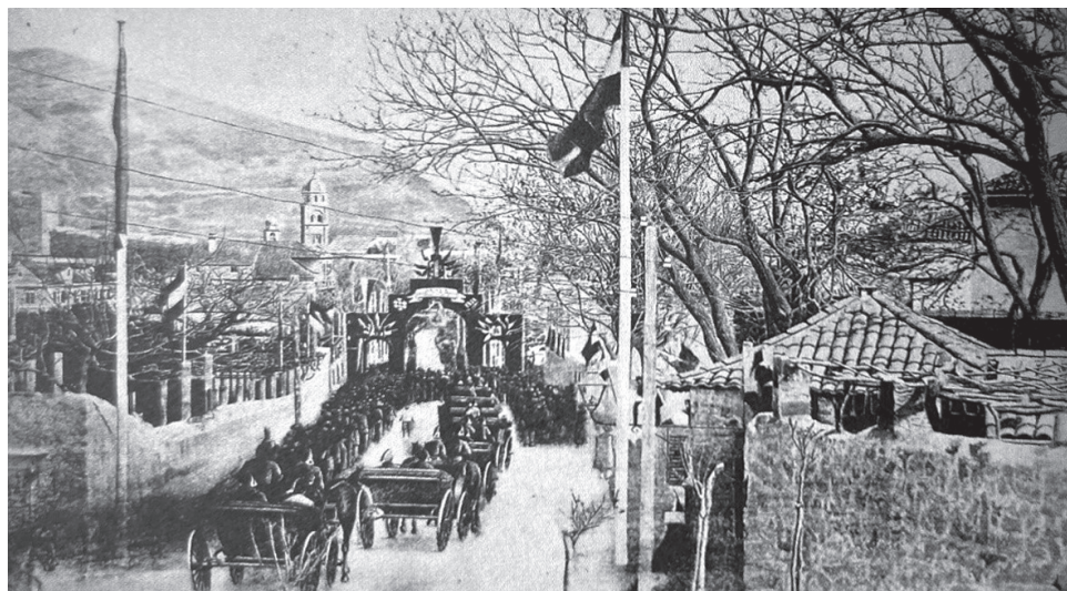
Slika 1. Svečani doček cara na Pilama.