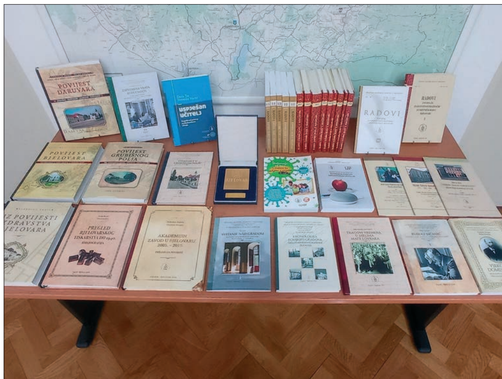
Rezultati nakladničke djelatnosti Zavoda u Bjelovaru