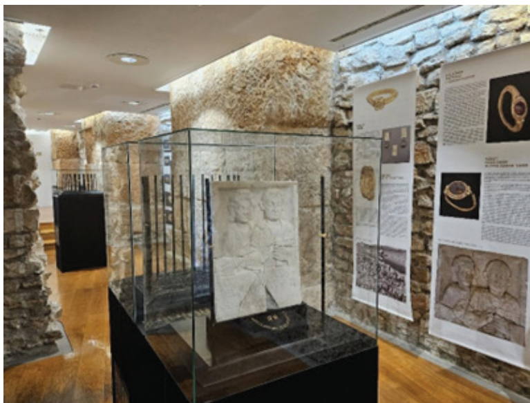
Slika 2: Izložbeni prostor

U prvu prostoriju posjetitelje uvodi mramorni reljef s poznatoga lokaliteta Aquae Iasae (Varaždinske Toplice). Reljef prikazuje raskošan nakit jednog rimskog para. Vidljive su krasne naušnice, ogrlice i prstenje. Uz sam reljef izložena su dva prstena s istoga lokaliteta izrađena tehnikom granulacije i filigrana. Riječ je o prstenu s prikazom scene „spajanja ruku” ( dextrarum iunctio ) i prstenu s umetnutom gemom. Cijeli prikaz nadopunjuju nalazi iz fundusa Arheološkog muzeja Istre, te par zlatnih naušnica i ogrlica s lokaliteta Burle. Osim informacija o tipologiji i izradi prstenja, posjetitelji su mogli saznati zanimljive običaje i zakone vezane uz nošenje zlatnoga nakita u Rimu. Naime, prstenje je najčešće nošeno na prstenjaku, kao i danas, ili pak na kažiprstu i malom prstu. Međutim, zlatni nakit bio je statusni simbol te privilegija rezervirana samo za pojedince. Tako su u doba Republike zlatni nakit nosili uglavnom patriciji i to samo za posebne prigode, dok je u doba Carstva taj običaj postao sve rašireniji te 197. g. po. Kr. dozvolu za nošenje zlatnoga prstenja dobivaju i vojnici.