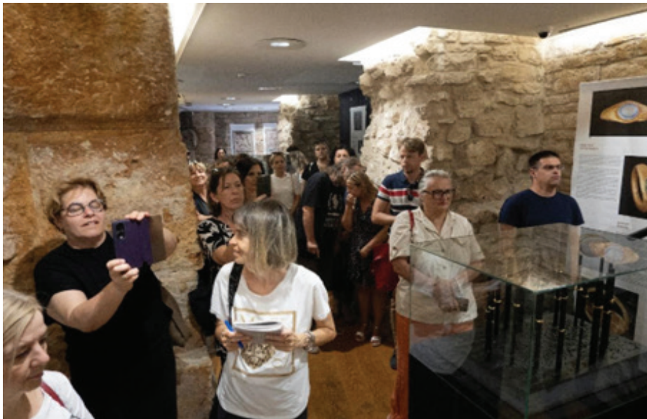
Slika 1: Otvorenje izložbe

Kroz izložbu su prikazani različiti tipovi prstenja koji datiraju od 1. do 4. stoljeća. Prstenje se razlikuje po načinu izrade i tipologiji, a svaki primjerak svojevrsni je pokazatelj mode vremena u kojemu je nastao. Izložba započinje generalnim prikazom zlatarstva u antici te načinima izrade zlatnoga nakita.