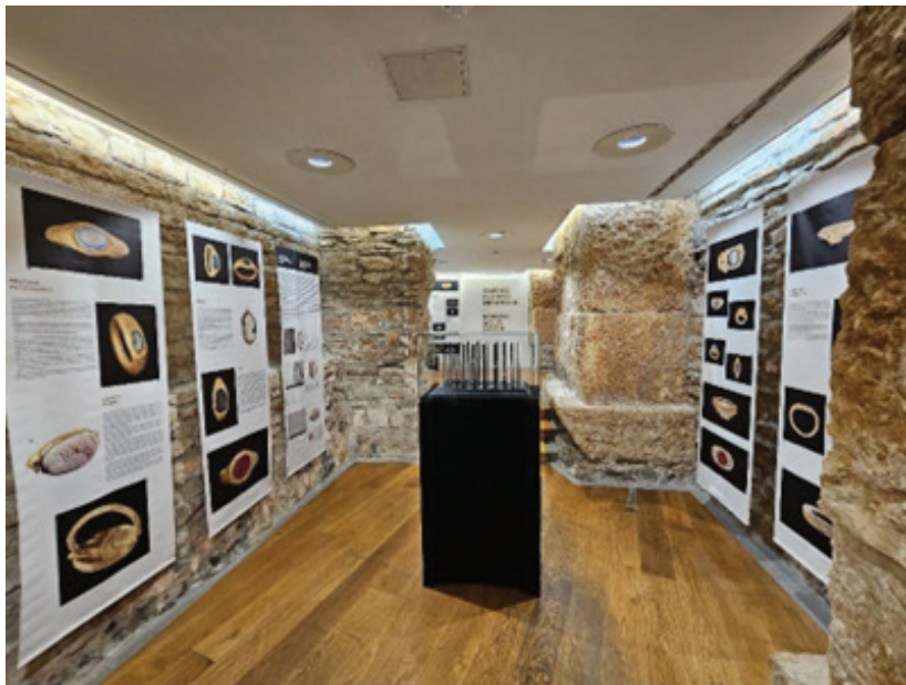
Slika 4: Primjerci prstenja tipa utere felix i prstenja s gemama